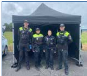
Městská policie Hořovice

✗ 22. 5. 2024 se strážníci účastnili dětského dne s IZT na letišti v Tlustici pořádané PČR. Zde děti a širokou veřejnost seznámili s úkoly a prací Městské policie. Pro nejmenší děti měli strážníci připravené zábavné hry se sladkou odměnou.