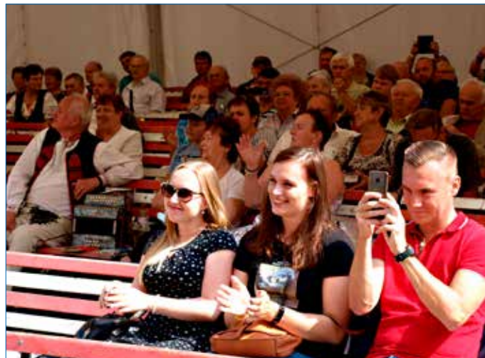
■ 43. ročník Hořovické heligónky se uskutečnil v sobotu 15. srpna v zahradě Společenského domu.