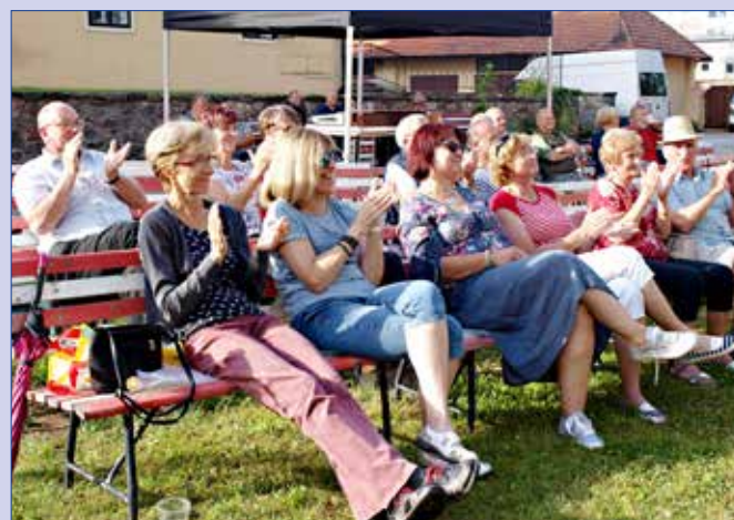
■ Letošní Hořovické kulturní léto mělo bohatý program a návštěvníci si určitě z pestré nabídky vybrali.

Festival pokračuje i v září. V neděli 6. září od 14:00 se na nádvoří Starého zámku uskuteční setkání