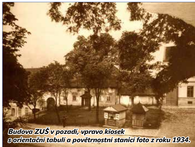
Budova ZUŠ v pozadí, vpravo kiosky s orientační tabulí a povětrnostní stanicí foto z roku 1934.

každého posádkového velitelství posádkovou hudbu o 60 hudebnících. Do služby se přihlásilo na 5 000 hudebníků. V roce 1919 vznikl inspektorát vojenských hudeb, který koordinoval vznik