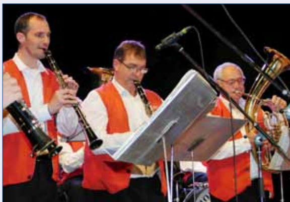
■ Návštěvníkům Jarního koncertu zahrála i Hořovická muzika.