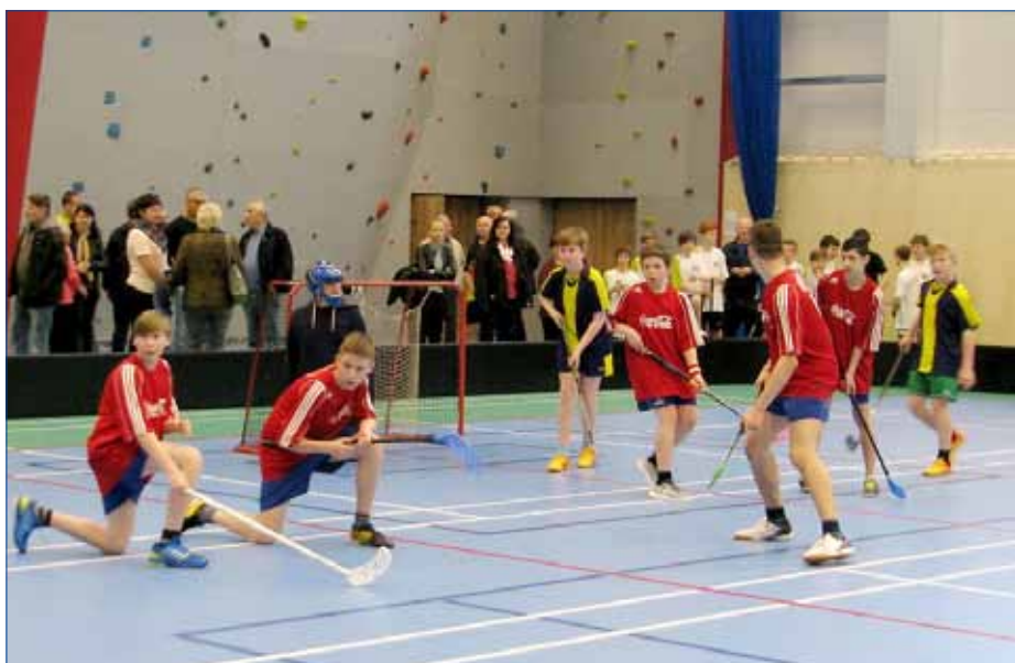
■ V nové hořovické sportovní hale se už odehrálo několik turnajů.