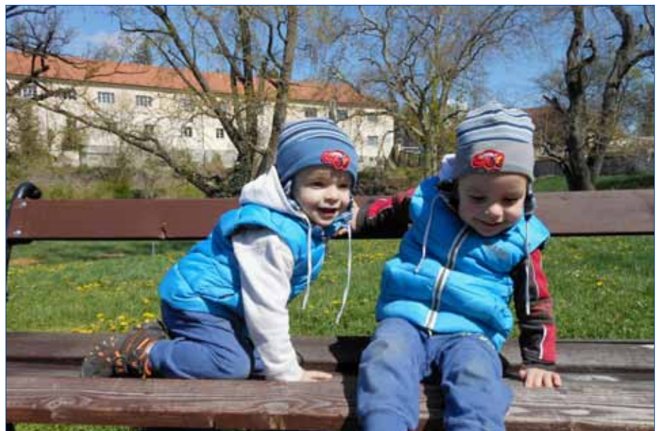
■ Panská zahrada láká děti i dospělé. Na začátku roku se Hořovičtí zaměřili i na její uzavřenou část, kde byly odborně upraveny dřeviny. V pozadí areál Starého zámku.