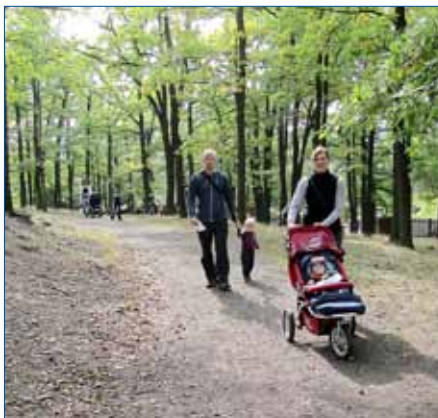
■ Lesopark Dražovka je vyhledávaným místem k odpočinku. Fotografie pochází z letošní akce Pohádkový les.

Hořovičtí radní se domnívají, že tato varianta může v budoucnu zviditelnit nejen lesopark, ale i město. Navíc může přinést řadu možností pro