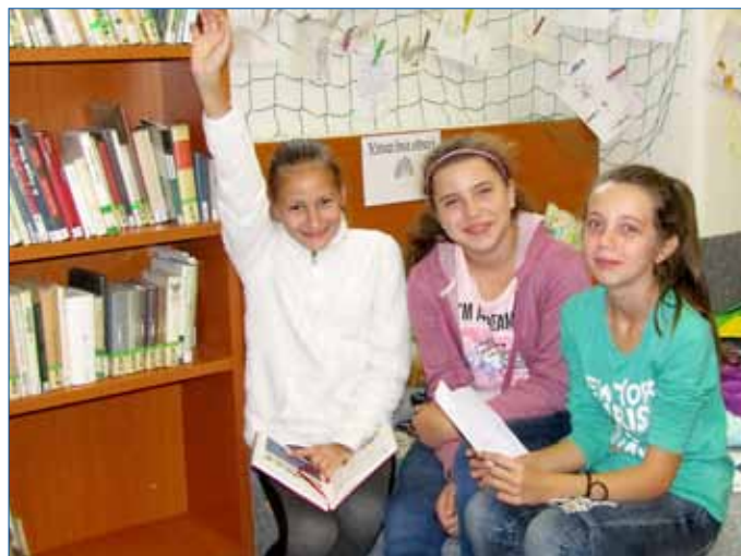
■ Hořovickou Knihovnu Ivana Slavíka navštěvují školáci pravidelně. Bavi je besedy i setkání s autory knih.