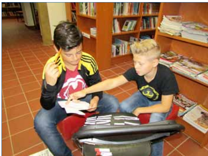
■ Při besedě v dětském oddělení si žáci vyzkoušeli orientaci v knihovně i knihách, hravou formou hledaly autora či ilustrátora.