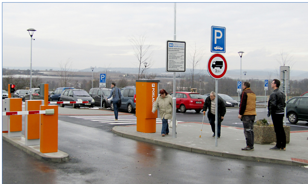
■ V pondělí 22. ledna bylo u hořovické nemocnice otevřeno nové parkoviště.

Dlouho očekávané parkoviště hořovické nemocnice otevřelo své brány v pondělí 22. ledna. Pacienti a návštěvníci nemocnice si zvykají na jeho provoz a také na nové regulace, které platí pro provoz vozidlem v areálu nemocnice.