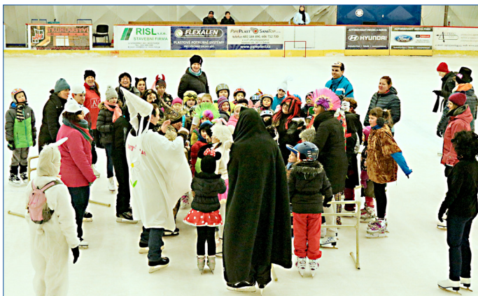
■ Maškarní odpoledne na bruslích pořádal spolek Sedmikráska. Na ledě při ní bruslilo osmdesát masek.