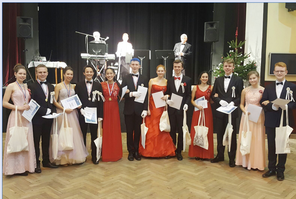
■ Finalisté taneční soutěže.