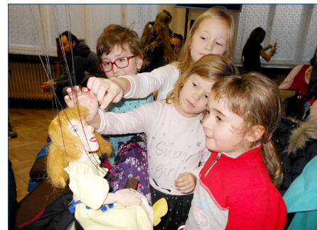
■ Mladí hořovičtí loutkáři odehráli ve Společenském domě pohádku Kocour v botách . Po představení šli s loutkami mezi děti.