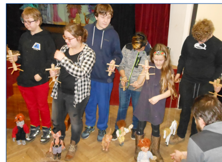
■ Loutkářský soubor Malá scéna MKC Hořovice má šestadvacet členů. Polovinu zastávají mladí herci, kteří v příštích týdnech nazkouší nové představení O třech malých kůzlátkách .