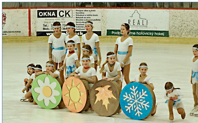
■ Oddíl krasobruslení z Berouna (TJ Kraso Beroun) připravil pro návštěvníky vystoupení Čtvero ročních období.