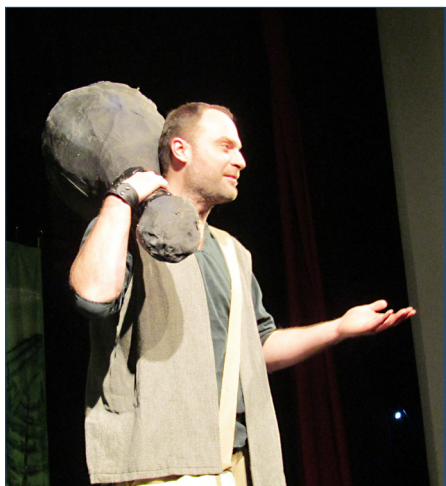
■ Pohádku O statečném kováři Mikešovi si děti užily v neděli 21. ledna.

Kocour v botách a o Statečném kováři Mikešovi. To byly názvy lednových pohádek, na které se děti přišly podívat do hořovického Společenského domu. Tu první nabídly děti dětem. Zahráli ji totiž nejmladší členové