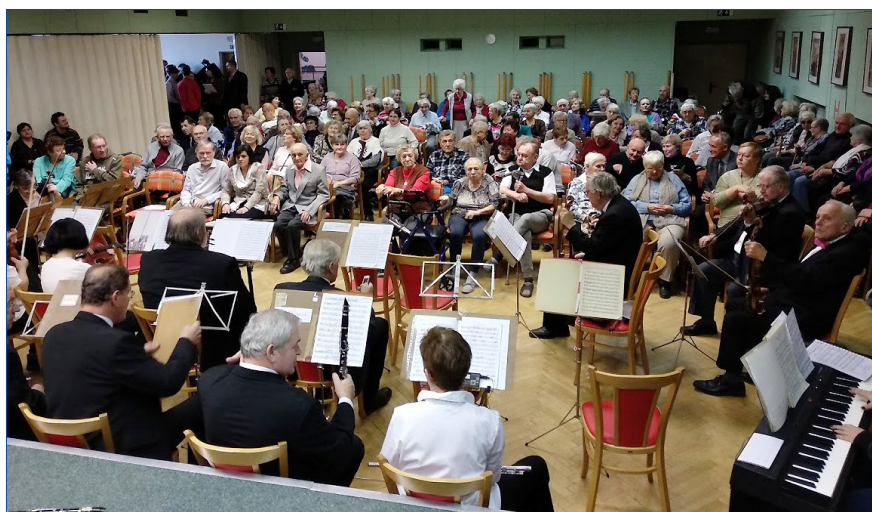
■ Rybovu mši zazpívali žáci ZUŠ i v Praze - Bohnicích.