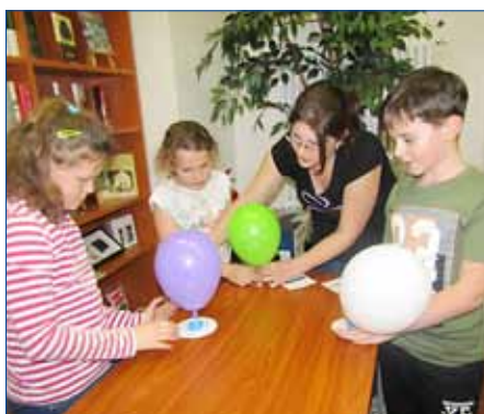
■ V knihovně nechyběla ani laboratoř, ve které se prováděly zajímavé pokusy.