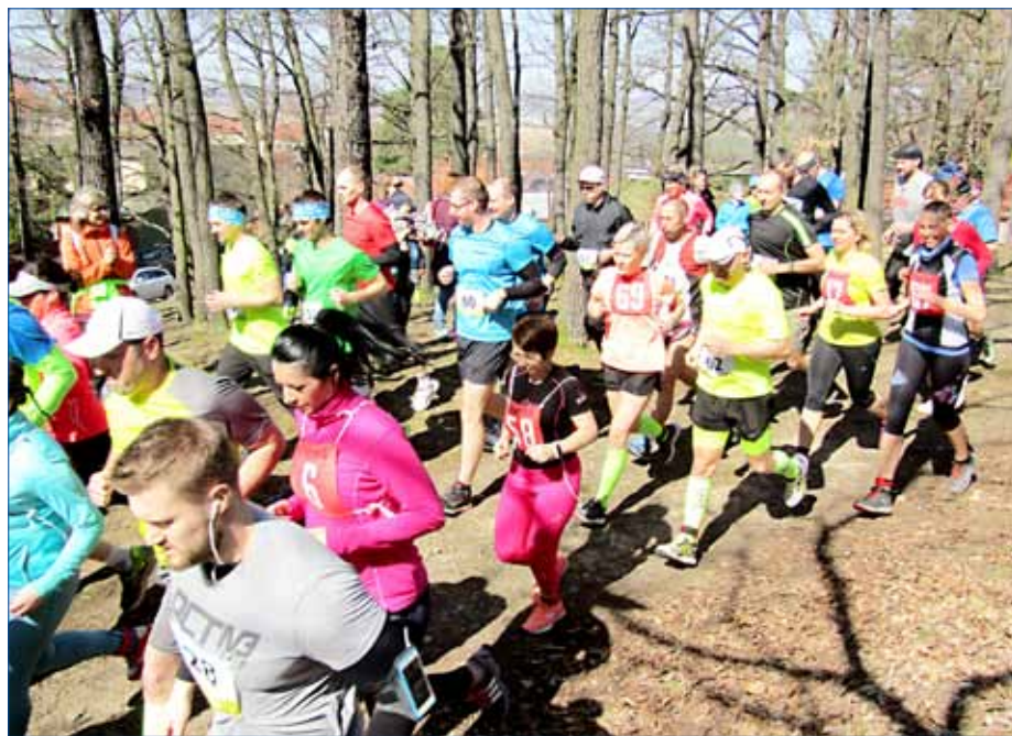
■ Hořovický lesopark Dražovka je oblíbeným místem odpočinku i sportovního vyžití. Na začátku dubna se zde uskutečnil 33. ročník Jarního běhu Dražovkou.