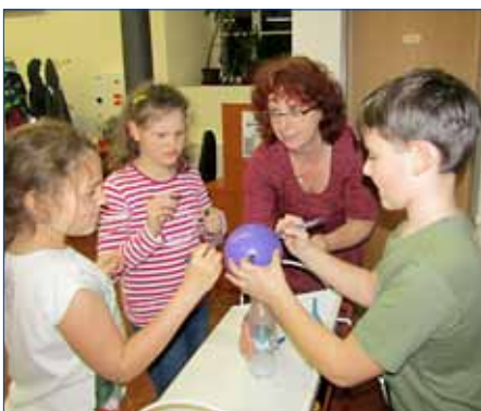
■ V hořovické Knihovně Ivana Slavíka na děti čekal šestihodinový program.