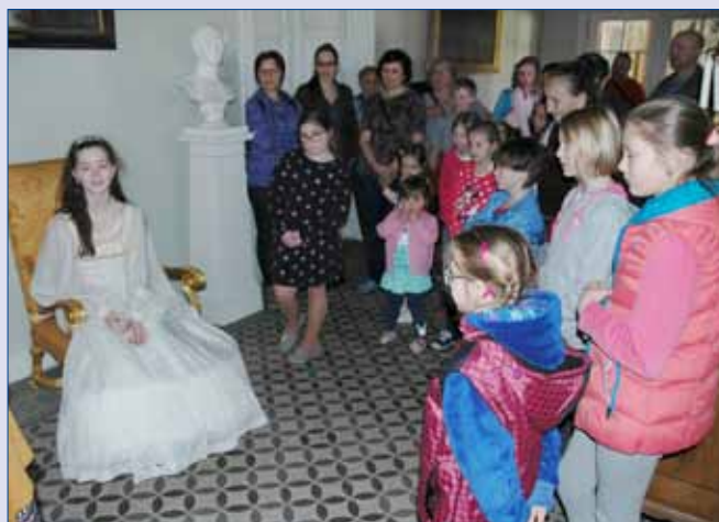
■ Zámek Hořovice nabídl v dubnu speciální prohlídky pro děti, nesly název Zpátky do století. V květnu se návštěvníci na zámku Hořovice setkají s pohádkovými bytostmi.