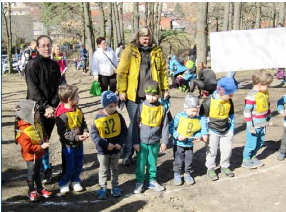
■ Na start letošního ročníku Jarního běhu Dražovkou se postavilo 302 závodníků včetně těch nejmladších.

Hořovický lesopark se už po jednatřicáté stal místem sportovní akce s názvem Jarní běh Dražovkou. Na startovní čáru letošního ročníku se postavilo 302 závodníků, kteří vyběhli na trasy přizpůsobené jejich věku. Pro nejmenší závodníky pořadatelé připravili trať o délce 300 metrů, muži museli zdolat trať nejdelší, měřila 8 kilometrů. Rozdílná délka tratí však neměla žádný vliv na nasazení startujících, všichni běželi naplno, i ti nejmladší. Závodníci bez rozdílu věku si tak vysloužili pochvalu pořadatelů. „Všichni jsou skvělí,“ prohlásila za pořadatele ředitelka závodu Jaroslava Kalátová. Zároveň ale upozornila, že pochvalu si nezaslouží mnozí diváci. „Začíná-