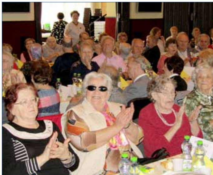
■ Jarní setkání seniorů si lidé užili ve čtvrtek 12. dubna v hořovickém Společenském domě.