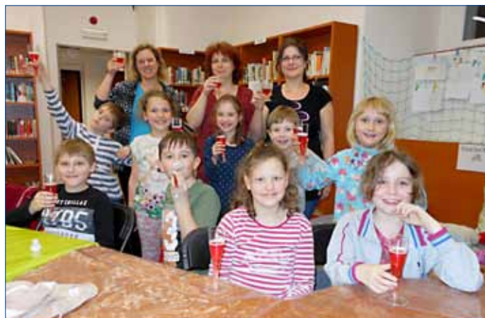
■ Pátý ročník Noci s Andersenem nesl podtitul Ducháčkovic rodina. Kromě čtení si děti užily spoustu her a soutěží.