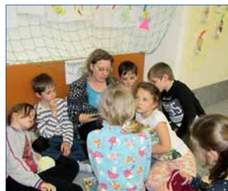
■ K Noci s Andersenem patří i společné čtení. 4x foto: Radka Kočová