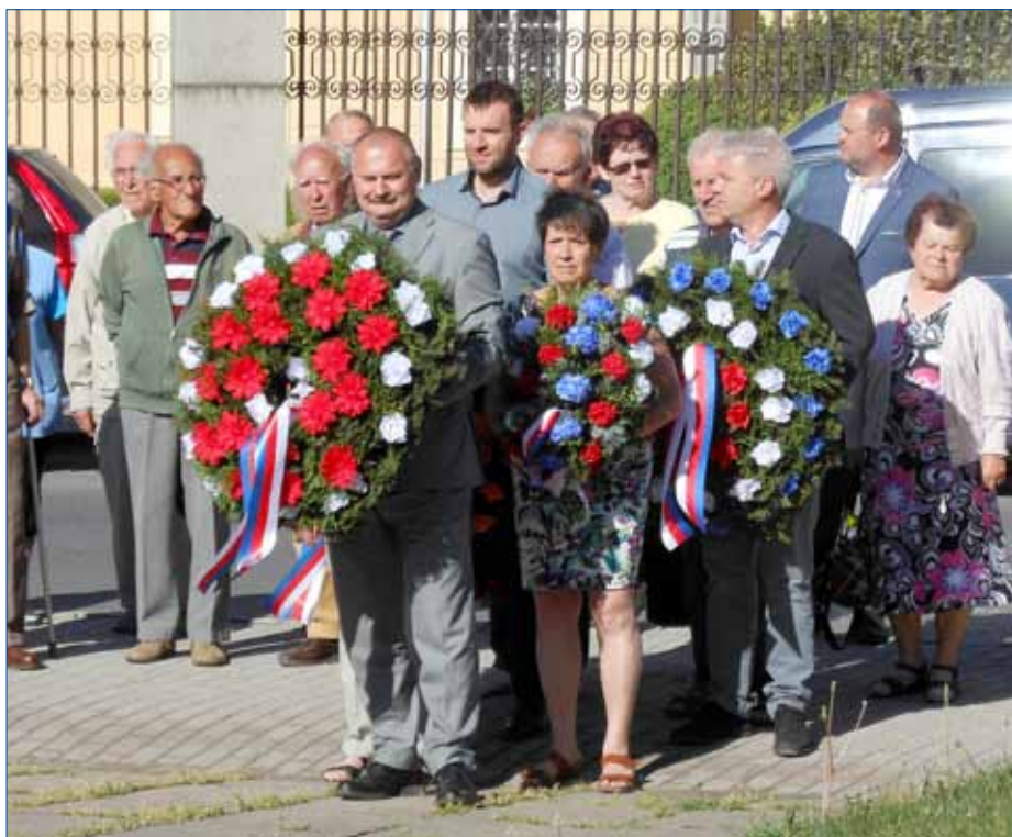
■ Hořovičtí uctili památku obětí druhé světové války.

Hořovický pietní akt pokládání věnců u sochy Obětovaný a na městském hřbitově se uskutečnil v pondělí 7. května. Zástupci města Hořovice, místní organizace Svazu bojovníků za svobodu a mnozí další se na těchto místech sešli v odpoledních hodinách. Starosta města Hořovice Jiří Peřina připomněl, že mezi oběťmi byli i občané města. „Položili život na oltář naší vlasti, na oltář naší budoucnosti, na oltář hlubokého míru, ve kterém dnes již 73 let žijeme. Tuto oběť nechceme nikdy zklamat,“ uvedl ve svém projevu starosta Hořovic Jiří Peřina.