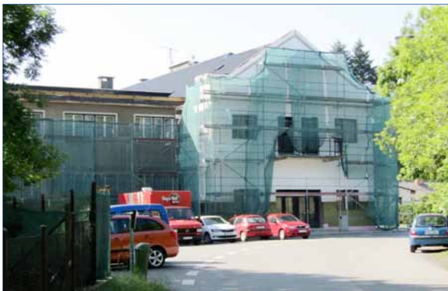
■ Na rekonstrukci Společenského domu město Hořovice získalo dotaci.

Ke zdárně dokončeným stavebním akcím přibyla ve sportovním areálu tenisová klubovna, již bude využívat a spravovat Městské sportovní