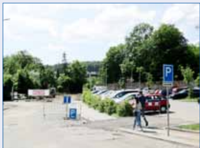
■ Rekonstrukce ulice K Nemocnici zatím probíhá podle plánu. S dokončením celého díla se počítá v říjnu letošního roku.