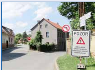
■ Omezení dopravy má přinést větší bezpečnost chodců v okolí školy.