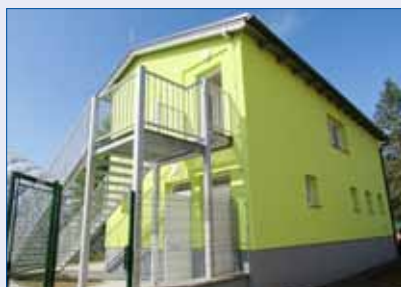
■ Od letošního června bude nová klubovna sloužit tenistům.