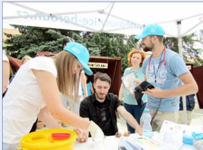
■ Ve stánku Nemocnice Hořovice se měřila hladina cukru v krvi i krevní tlak.

Zástupci hořovického odboru sociálních věcí a zdravotnictví děkují všem, kteří se akce Představme se! zúčastnili i těm, kteří s Městským úřadem Hořovice spolupracují. (rak)