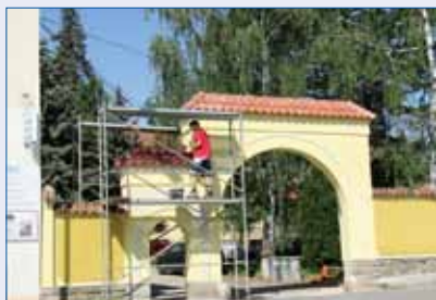
■ Součástí obnovy brány u Starého zámku bude i informační systém.