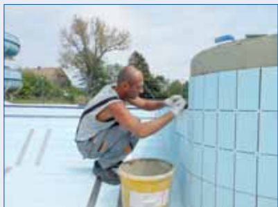
■ Opravy venkovních bazénů na koupališti byly rozsáhlejší, než se čekalo. Nezbytná bude jejich celková rekonstrukce.