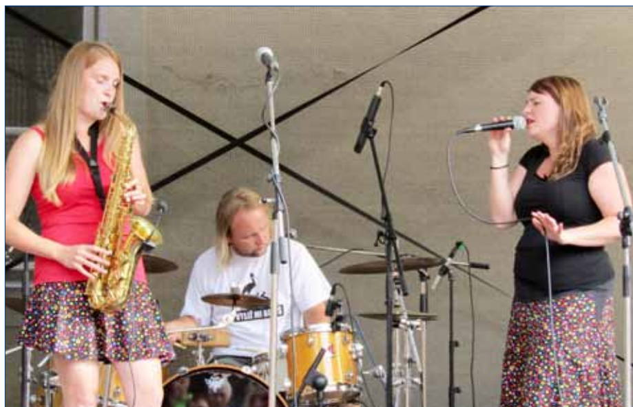
■ Koncert skupiny La Fanka na nádvoří Starého zámku si návštěvníci užili v neděli 15. července. Hudební podvečer byl součástí Hořovického kulturního léta.

Prázdniny se nám pomalu překlápí do své druhé poloviny, ale pokud jde o kulturu v Hořovicích, určitě se nejedná o okurovou sezónu. Městské kulturní centrum připravilo celou řadu kulturních podniků, které stojí za zhlédnutí.