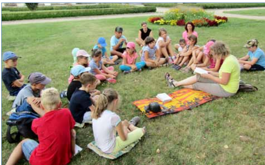
■ Prázdninové čtení Knihovny Ivana Slavíka si děti užily v zámeckém parku.