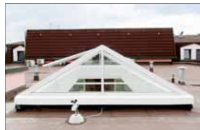
■ Původní světlík budovy hořovického Domova Na Výsluní nahradil nový.

Nový světlík je vybavený čidly na dešť i vítr. Pokud začne pršet, nebo se zvedne silný vítr, okna světlíku se automaticky uzavřou. (rak)