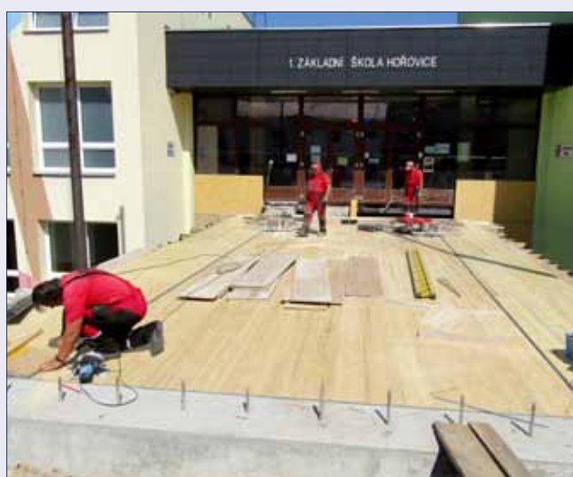
■ O prázdninách se staví nová lávka u 1. základní školy Hořovice.

Ve čtvrtek 23. srpna bude knihovna z důvodu přechodu na nový knihovnický systém otevřena až od 12:00.