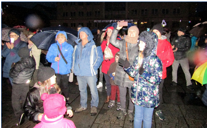
■ Diváci si sváteční program užili i v nepříznivém počasí.