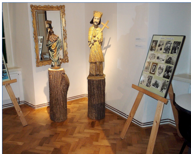
■ Adventní výstava Muzea Hořovicka se letos nesla v duchu kolekce vánočních pohlednic z období první republiky až do minulosti nedávné.

Panely byly doplněny vitrinou s kalendáři z nakladatelství UMŮN, které podporuje postižené umělce malující ústy a nohama. Na vernisáži vystoupil komorní sbor ZUŠ Josefa Slavíka Hořovice s výběrem z Rybovy České mše vánoční. Během adventu si vánoční výstavu prohlédlo bezmála 270 návštěvníků. Anna Brotánková