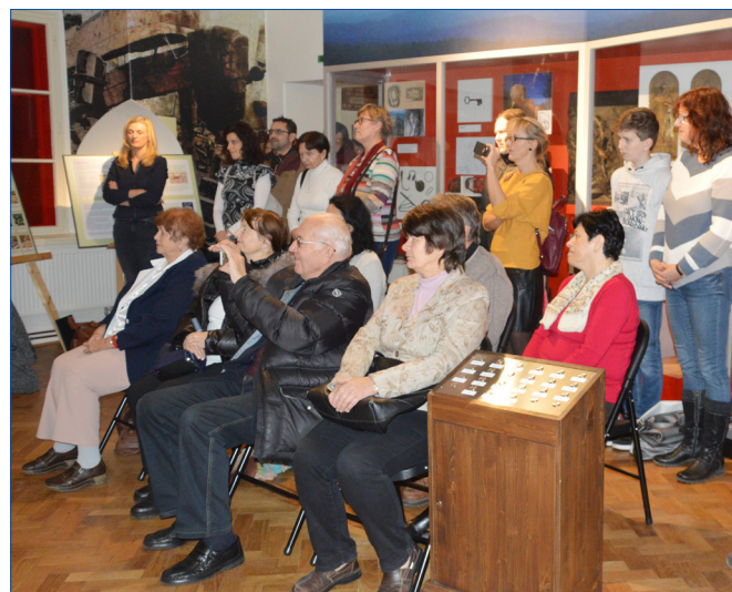
■ Během adventu si vánoční výstavu Muzea Hořovicka prohlédlo bezmála 270 návštěvníků.