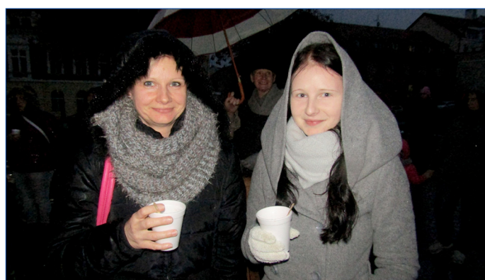
■ Deštivé počasí přímo vybízelo zahrát se třeba svařeným vínem.

Na náměstí se lidem otevřely stánky s nápoji i občerstvením a uskutečnilo se zde dvouhodinové hudební a taneční vystoupení. Na podiu se představily děti místní mateřské školy i osovského tanečního kroužku. Dále zde vystoupily Hořovické Mažoretky a kytarové kroužky Domečku Hořovice. Přízemí úřadu se proměnilo v kreativní dílny, všichni zájemci si zde mohli vyrobit vánoční výzdobu či dárek. Přestože první adventní neděle, kdy se sváteční hořovické setkání uskutečnilo, propršelo, návštěvníkům to příliš nevadilo. Bylo jich plné Palackého náměstí. Ti největší vytrvalci byli krátce před 17. hodinou svědky rozsvícení vánočního stromu. (rak)