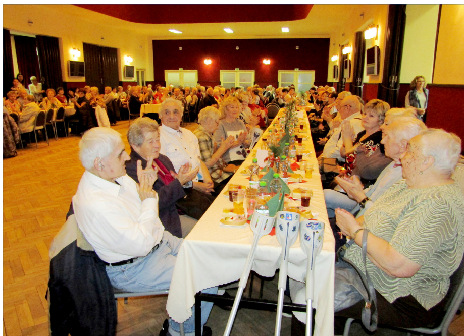
■ Akce se zúčastnilo dvě stě hostů z Hořovic, Žebráku, Berouna a Hostomic.