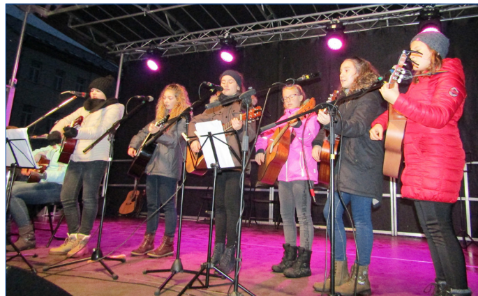
■ Na pódiu se odehrával bohatý program. Vystoupily zde i kytarové kroužky Domečku Hořovice.