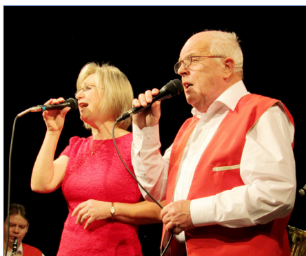
■ Sváteční setkání seniorů zpestřila Hořovická muzika.

Pozvání na hořovické předvánoční setkání přijali nejen místní senioři, ale i ze Žebráku, Berouna a Hostomic. Počet hostů tradiční akce, která se konala ve čtvrtek 6. prosince se tak vyšplhal až ke dvěma stům.