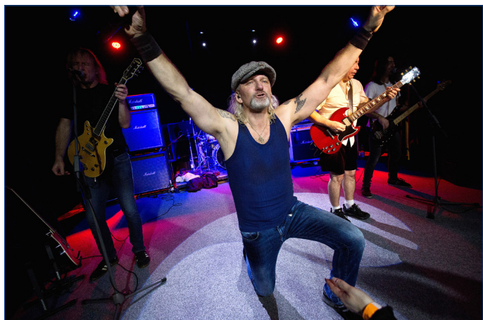
■ Oblíbená revivalová skupina se do hořovického klubu Labe vrátí v pátek 17. ledna 2020.