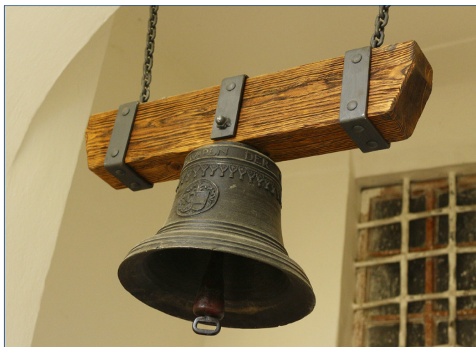
■ Vítězná foto kategorie B: Václav Babel