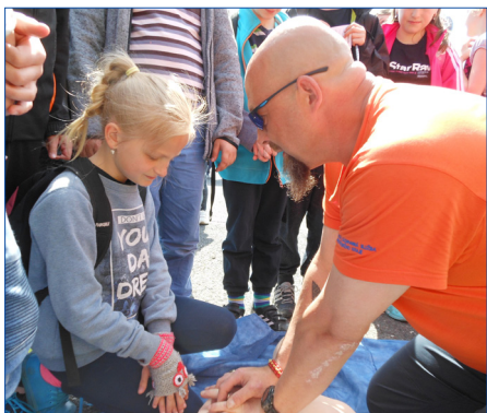
■ Na Velké ceně Hořovice se pravidelně prezentují všechny složky Záchranné integrovaného systému. Nechybí ani zdravotní záchranná služba.

Nechtějí opomenout ani to, že hořovická hasičská stanice byla postavena v roce 1972. Od té doby ji využívali dobrovolní hasiči a ve zmíněném