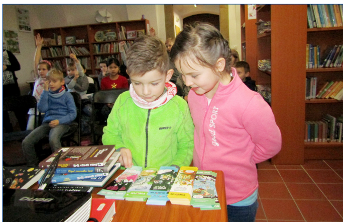
■ Zábavné dopoledne se v hořovické knihovně konalo v pátek 18. ledna.