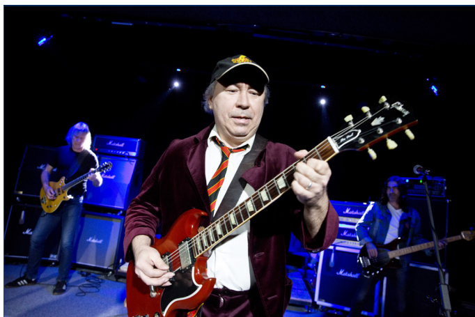
■ Skupina AC/DC REVIVAL ŠPEJPLS'HELPRS rozparádila fanoušky na začátku ledna v hořovickém Labi.