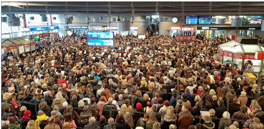
■ Hořovičtí sboristé nechyběli ani na zpívání Rybovy vánoční mše na Hlavním nádraží v Praze.