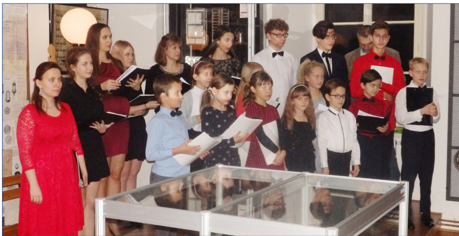
■ Komorní pěvecký soubor ZUŠ Josefa Slavíka Hořovice zahájil v prostorách Muzea Hořovicka ve Starém zámku výstavu VÁNOČNÍ POHLEDNICE A KALENDÁŘE.