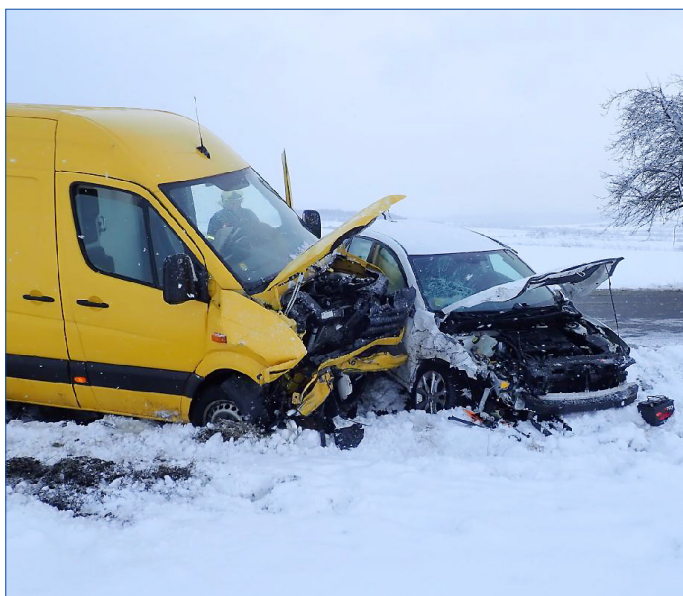
■ Také na Hořovicku se řidiči potýkali s ledovkou. Cesta Hořovice – Záluží ve čtvrtek 10. 1. 2019 v 9:00.