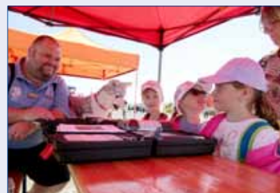
■ Hořovičtí strážníci se představili i na Velké ceně Hořovice, kterou v závěru dubna na tlustickém letišti uspořádal HZS Hořovice.