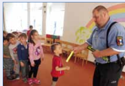
■ Městská policie Hořovice se věnuje i prevenci ve školách. Na snímku návštěva v komárovské mateřské škole.