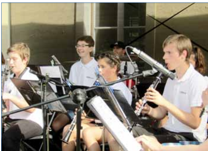
■ Muzikantské mládí zastoupili i žáci ZUŠ Hořovice s kapelou Horband.