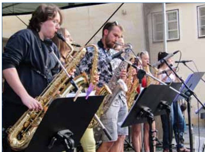
■ Na nádvoří Starého zámku se představila i kapela Roofers z Příbrami.