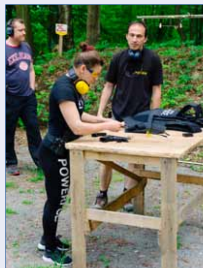
■ Městská policie Hořovice uspořádala první ročník střelecké soutěže. Konala se na střelnici v Novém Jáchymově a kromě hořovických strážníků se jí zúčastnili i zástupci Policie ČR.