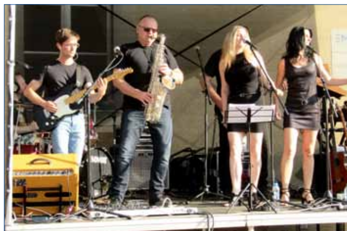
■ V neděli 23. června Hořovické kulturní léto pokračovalo koncertem revivalové skupiny CZ FLOYD – Pink Floyd Tribute Band.

Horband, Roofers, Grippeds. To jsou názvy tří kapel ze tří základních uměleckých škol. Jmenovaná hudební seskupení působí v Hořovicích, Příbrami a Rakovniku a na nádvoří hořovického Starého zámku zahrála v neděli 9. května při zahájení letošního ročníku Hořovického kulturního léta. Koncerty mladých muzikantů sledovaly desítky diváků, kteří si mohli podvečer zpestřit i návštěvou Galerie Starý zámek a Muzea Hořovicka.