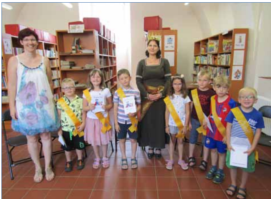
■ V hořovické knihovně se nechalo na čtenáře pasovat osm žáčků z tlustické školy.

Celkový počet pasovaných čtenářů se nakonec vyšplhal na rovných 150. O necelý týden později se v hořovické knihovně nechalo totiž pasovat dalších osm malých čtenářů, kteří přijeli ze Základní školy Tlustice. (var)