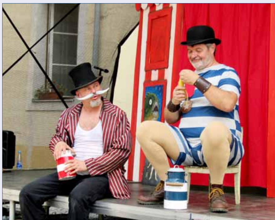
■ Hořovické kulturní léto baví děti i dospělé. Bylo tomu tak i při hře VŠETEČKA, kterou v neděli 23. června na nádvoří Starého zámku odehráli herci Divadla NA HOLOU. Program HKL 2019 na straně 2.

i dalšími intenzivně pracovala na zjištění původu a intenzity kontaminace. Výše zmiňované nezávislé posudky jednoznačně potvrdily, že současný provoz skládky nemá s tímto incidentem nic společného. Zároveň prověřování