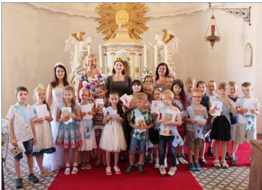
■ Pozvání na Pasování prvňáčků na čtenáře přijala i I.B 1. Základní školy Hořovice.