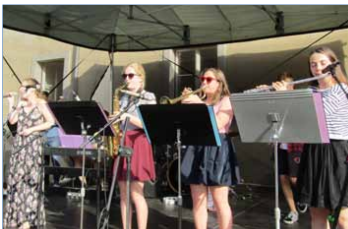
■ Trojici kapel základních uměleckých škol uzavřela rakovnická s názvem Grippeds.