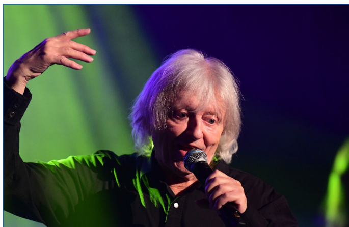
■ K vrcholům letošního kulturního roku určitě patřil koncert Václava Neckáře.