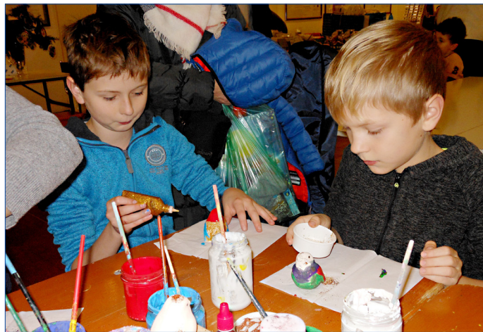
■ V kreativních dílnách, které připravilo sdružení Sedmikráska, si mohli lidé vytvořit rozmanité vánoční dekorace.