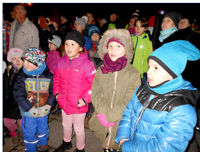
■ Při vánočním setkání návštěvníci zcela zaplnili hořovické Palackého náměstí. Bohatý hudební program vyvrcholil rozsvícením nového vánočního stromu. Více na str. 2.

to také na převod objektu Městské mateřské školy na Větrné, který se město snaží získat od Národního institutu dalšího vzdělávání již více než 10 let. Předpokládáme, že vzhledem k reorganizaci uvedené instituce a jejímu sloučení s jinou státní organizací, dojde k urychlení zmíněného převodu. Budovy sice stát na město převede zdarma, bohužel za pozemky budeme muset zaplatit z městského rozpočtu. Jedná se o více než 4 milióny Kč.