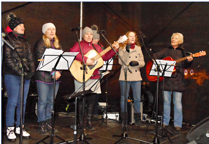
■ Na Palackého náměstí zněly koledy v podání hudebníků Domečku Hořovice (na snímku) i Strašické pohody.