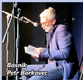
Básník Petr Borkovec