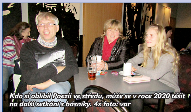
Kdo si oblíbil Poezii ve středu, může se v roce 2020 těšit i na další setkání s básníky.