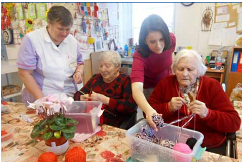
■ Seniori Domova Na Výsluní se pravidelně scházejí v klubovně, kde tvoří dekorační předměty, pletou šály i čepičky pro novorozence.

20. Další projekty se připravují. Zástupci Domova budou usilovat o nové výtahy, klimatizace do pokojů ve třetím a čtvrtém patře. Prostřednictvím zřizovatele je podána žádost o dotaci z prostředků MPSV na rekonstrukci koupelen a pořízení stropního zvedacího a asistenčního systému. (var)