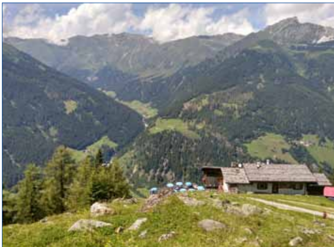
■ Tobias Pastucha 7 let (vítěz kategorie A).