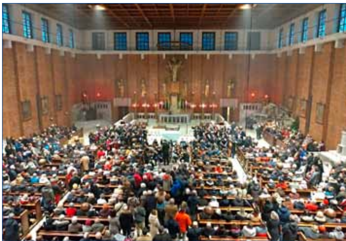
■ Koncert v kostele Nejsvětějšího Srdce Páně na Vinohradech.