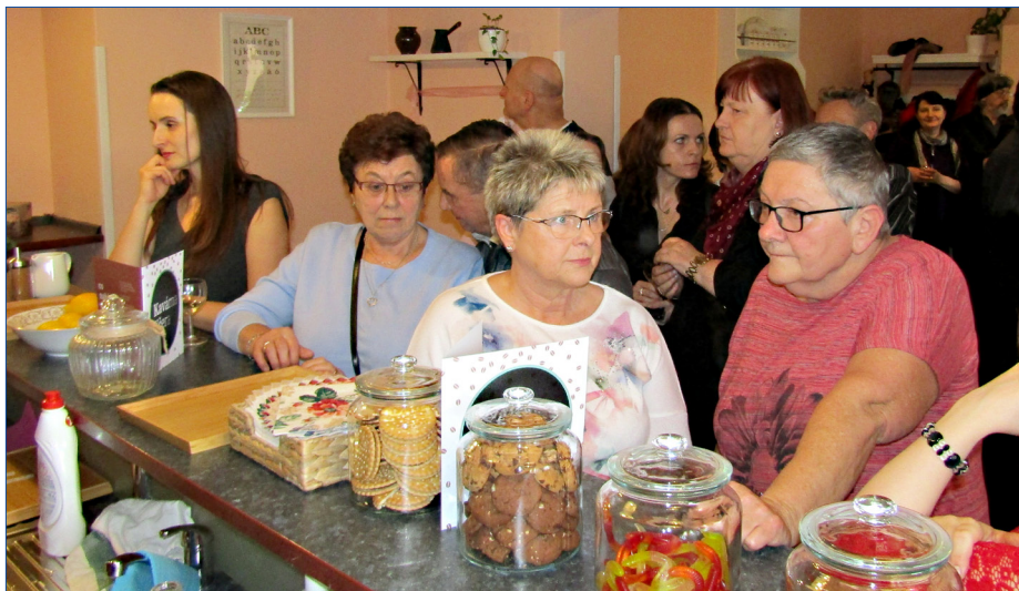
■ Slavnostní otevření Kavárny Včera si nenechali ujít zástupci města, městského úřadu i veřejnosti.