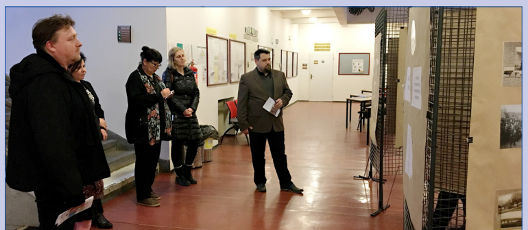
Výstava Mikroregionu Hořovicko byla instalovaná v budově městského úřadu, č.p. 640.

Přístup k výstavě omezila karanténa. Po jejím ukončení bude expozice otevřená v otevírací době úřadu. (var)