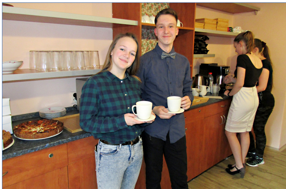
■ Kavárna Včera byla otevřená v únoru. Jde o první kavárnu svého druhu v republice.

V.M.: Nemáme. Taková čísla neexistují. I pro celou Českou republiku se používají prevalenční studie ze zahraničí.