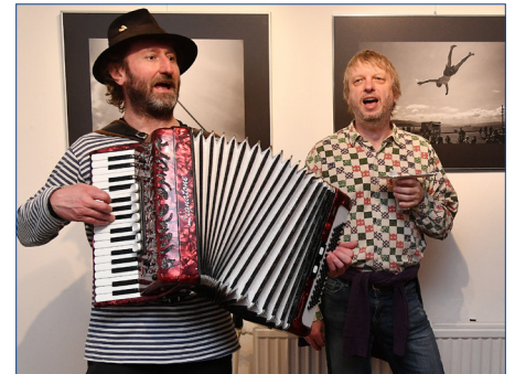
Vernisáž výstavy Berounských fotorigi se v hořovické Galerii uskutečnila 5. března. Hudební vystoupení se konalo v režii Vladimíra Františka Mužíka.