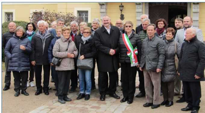
Partnerství s italským městem Ronzo Chienis se začalo rodit v roce 2018.

Rád bych vyzval každého, koho to zajímá, aby mne oslovil. Může k tomu využít emailovou adresu drulak@mesto-horovice.cz