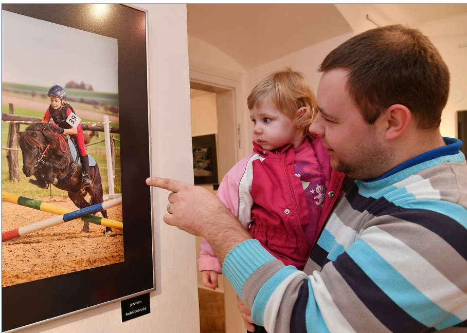
Výstava Berounských fotorigi v hořovické Galerii Starý zámek začala 5. března.