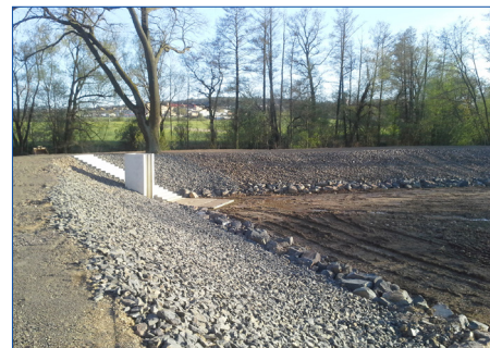
■ Rybník Valcverk prošel kompletní revitalizací.