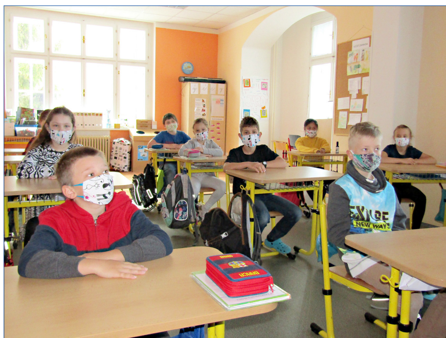
■ V pondělí 25. května se mohli vrátit do základních škol žáci prvního stupně. Na snímku první vyučovací hodina 3B, 2. základní školy Hořovice. Více na str. 4.

Od 1. června bude na internetových stránkách Městské správy bytového a nebytového fondu, která sběrný dvůr provozuje, také