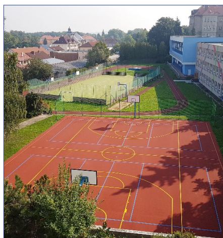
■ Školní hřiště u 1. základní školy Hořovice má nový povrch.