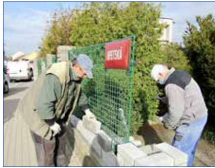
■ Úprava jednoho ze vchodů na hořovický hřbitov.

Kontejnerů na tříděný odpad neustále přibývá, a s tím bohužel také nepořádek kolem nich. Proto „radnice“ jedná o jejich častějším vyvážení na úkor zvyšování počtu kontejnerů. Hořovické technické služby upravily stání pro kontejnery u restaurace Kréta, kde bohužel vzhledem k čet-