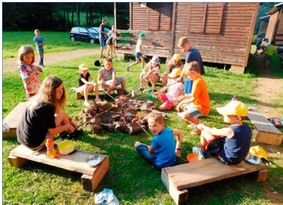
■ Pracovníci Domečku Hořovice se v dubnu pustili do příprav několika variant dětských táborů.