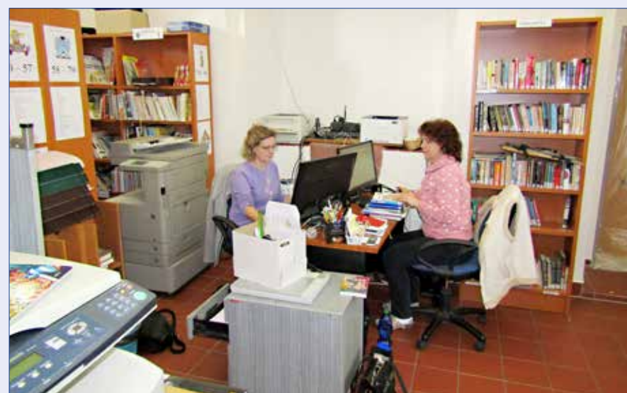
■ Městské kulturní centrum využilo uzavření knihovny k přesunutí stavebních prací v jejím zázemí z léta na jarní měsíce. Provizorní kancelář je nyní v dětském oddělení knihovny.