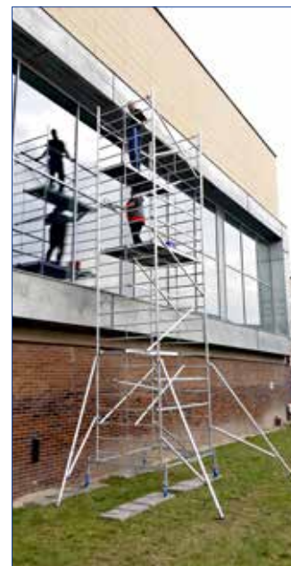
■ V hořovickém plaveckém bazénu a aquaparku probíhají úklidové práce.

Jaroslav Sedlák, ředitel Městského sportovního centra Hořovice