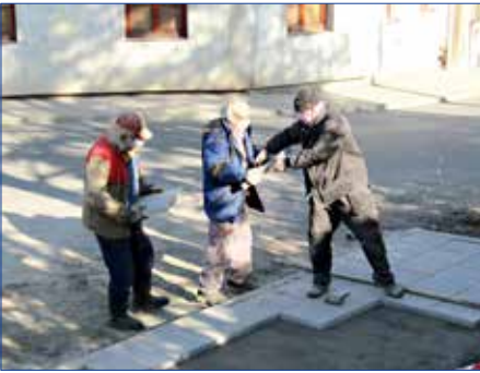
■ Úprava stání pro kontejnery u restaurace Kréta.

Jak přibližují fotografie, pracovníci Technických služeb Hořovice v těchto týdnech prováděli úpravu stání pro kontejnery i rekonstrukci jednoho ze vchodů místního hřbitova.