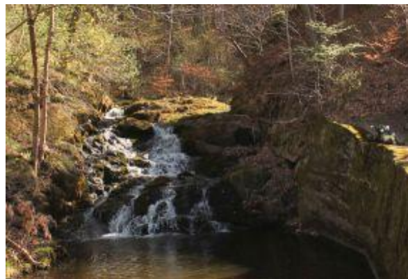
Vodopád, kostel Panny Marie v Mrtníce, skála