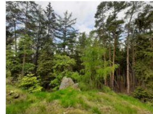
vrch Hlava, roubenka v Kleštěnici, vrch Jivina