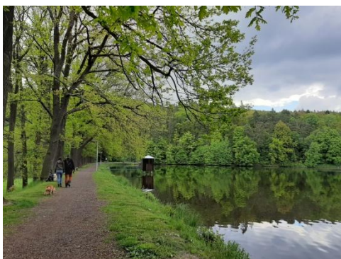
Hráz Červeného rybníka

Na cestě uvidíte to nejhezčí, co zdejší oblast nabízí: