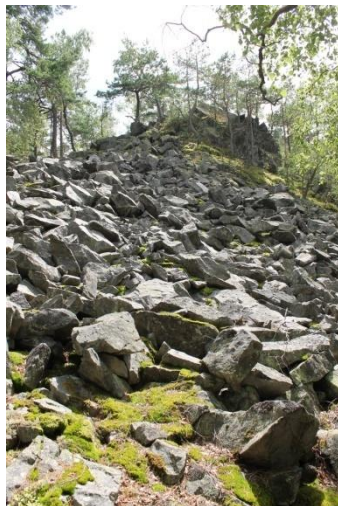
Tzv. Malý Beran s vyhlídkou