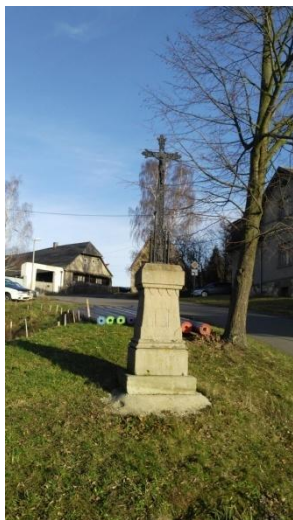
křížek na návsi v Kvani