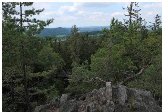
Vrchol vrchu Beran