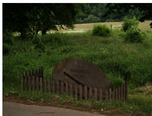
Obrázek č. 1 Josefova štola