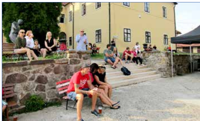
■ Návštěvníci koncertů na nádvoří Starého zámku si oblíbili schodiště, které vede ke galerii a muzeu.