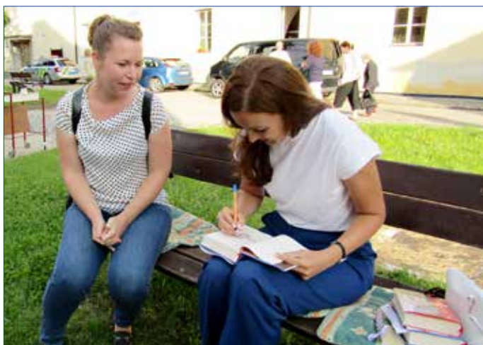
■ Spisovatelka si našla čas i na autogramiádu.