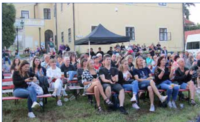
■ Na prvním koncertu Hořovického kulturního léta 2021 si návštěvníci užili vystoupení revivalových skupin Queen Pilsen Tribute a Bohemian Pink Floyd.