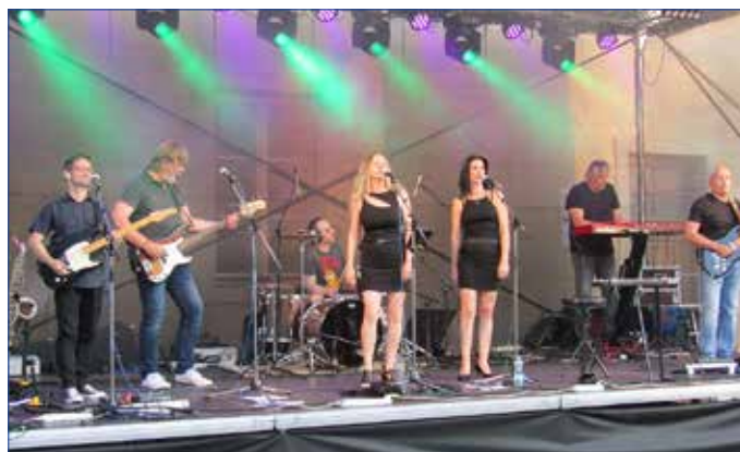
■ Revivalová kapela Bohemian Pink Floyd vystoupila na nádvoří hořovického Starého zámku koncem letošního června.