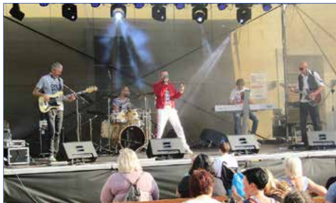
■ Skladby legendární kapely Queen se na nádvoří Starého zámku rozezněly poslední červnovou nedělí úderem 18. hodiny.