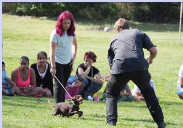
■ Ukázka výcviku psů.