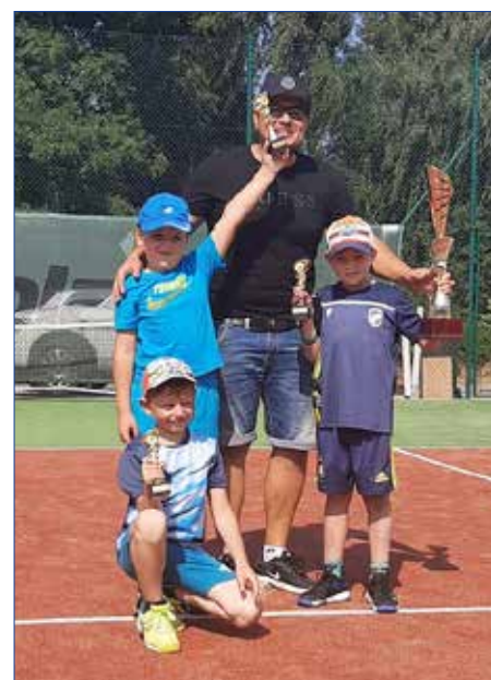
■ Trojice vítězů minitenisu z Hořovic.