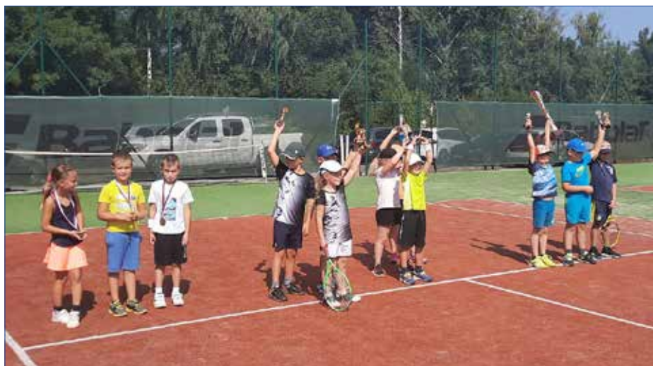
■ Účastníci finálového turnaje Středočeského kraje v minitenise - SK Tennis Kladno, TK Hořovice, LTC Mladá Boleslav, TO Sokol Nehvizdy.

Promítání a za jasného počasí pozorování Měsíce a planet Jupiter a Saturn v těsné blízkosti a dalších objektů noční oblohy. A také křest planety Žebrák na hradě Žebrák. To vás čeká tuto noc. Vzhledem k omezené kapacitě místa bude nutné se rezervovat pomocí rezervačního formuláře na webu hvězdárny. K dispozici bude měsíc před akcí.