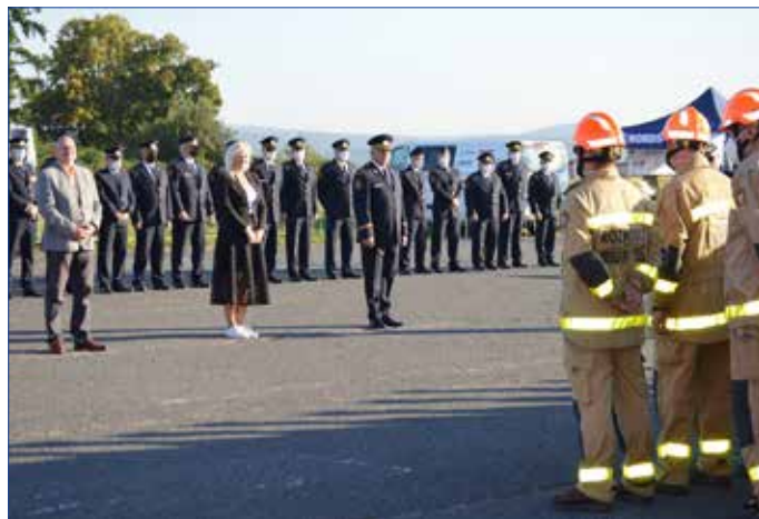
■ Slavnostní zahájení krajské soutěže ve vyprošťování u dopravních nehod.

péče,“ popsala Tereza Fliegreová s tím, že rozhodčí za oblast taktiky hodnotí především provedení samotného pokusu a způsob, jakým probíhá velení na fiktivním místě zásahu. Rozhodčí z oblasti techniky hodnotí volbu a správnost použití vyprošťovacího zařízení, pomocné techniky a nástrojů. V oblasti předlékařské péče, jak už název sám napovídá, se hodnotí samotná práce s fiktivně zraněným figurantem. Za každou tuto oblast mají soutěžící možnost dostat odpovídající počet bodů. Finální pořadí proto neurčuje pouze samotná rychlost pokusu, ale i bodový součet za hodnocené oblasti.