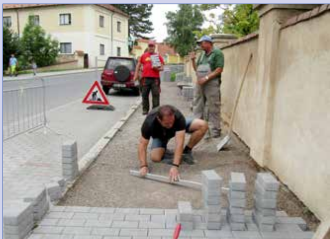
■ Chodník podél státního zámku Hořovice opravovali v průběhu měsíce září pracovníci Technických služeb města Hořovice.