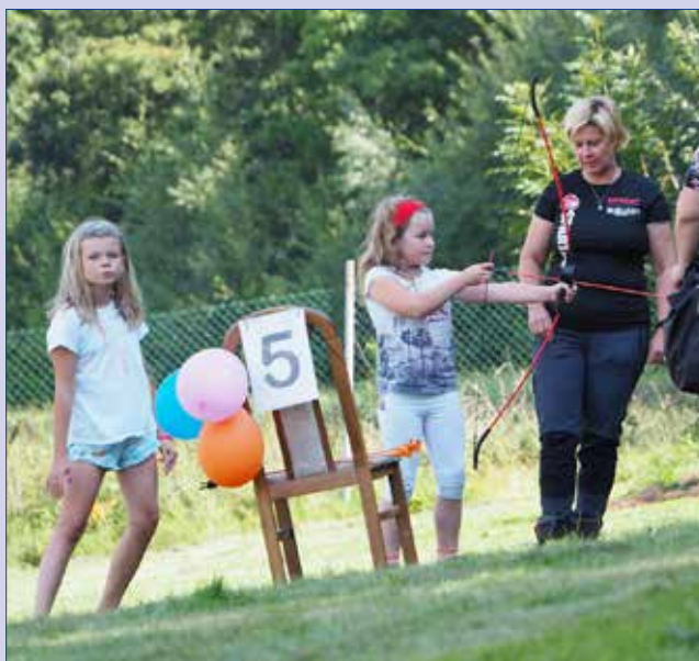
■ Soutěžící si vyzkoušeli různé dovednosti. Na snímku stanoviště s lukostřelbou.