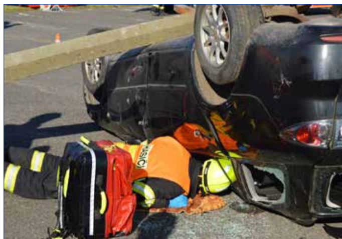
■ Soutěžící si museli poradit s těžkým a časově náročným scénářem. Hořovičtí se z jedenácti soutěžních týmů umístili na krásném čtvrtém místě.

Vodochody. Zároveň v rámci klání proběhl nesoutěžní pokus jednotky sboru dobrovolných hasičů obce Rudná, která bude reprezentovat Středočeský kraj na Mistrovství ČR jednotek sboru dobrovolných hasičů obcí ve vyprošťování u dopravních nehod, které proběhne poslední zářijovou sobotu v Praze. „Každý tým je sestaven ze čtyř členů, z nichž jeden musí být zařazen na pozici zdravotníka a další na pozici velitele. Během pokusu, na který mají soutěžní týmy 20 minut, hodnotí sbor rozhodčích správný postup při vyprošťování, a to z hlediska tří odvětví – taktika, technika a předlékařská