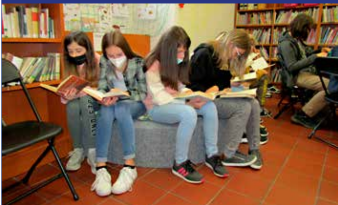
■ Hořovickou knihovnu Ivana Slavíka navštěvují školáci všech věkových kategorií, v září se do ní vypravili chlapci a děvčata ze sekundy Gymnázia Václava Hraběte.