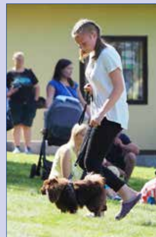
■ Ukázka chůze u nohy.