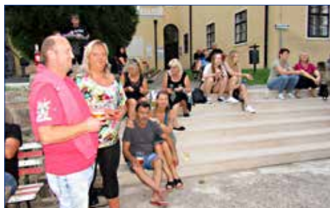
■ Ve druhé polovině července na nádvoří hořovického Starého zámku se uskutečnil rockový večer.

V sobotu 24. července na nádvoří hořovického Starého zámku zahrály dvě rockové kapely. Od 18 hodin zde vystoupila skupina Akrobat, o dvě hodiny později podium patřilo skupině Alkohol revival. Kapely nabídly posluchačům výjimečný zážitek. Obě hudební vystoupení se uskutečnila v rámci Hořovického kulturního léta 2021, jehož pořadatelem je každým rokem Městské kulturní centrum Hořovice. (var)