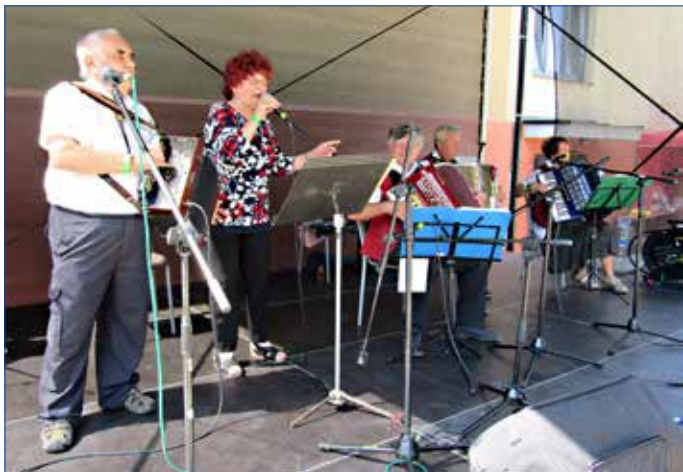
■ Hosty 44. ročníku Hořovické heligonky byli Liberečtí harmonikáři.