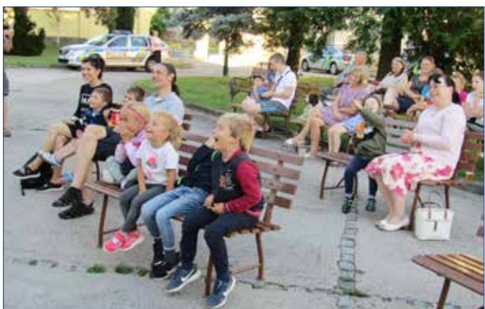
■ Hradozámecká noc Muzea Hořovicka potěšila malé i velké návštěvníky.