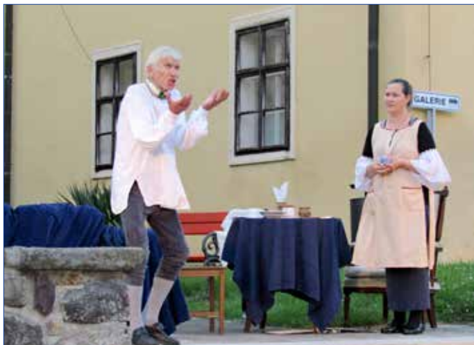
■ Hra hořovického Divadla Na Víšce nesla název Casanova na Duchcovském zámku LP 1798.

Dovedete si představit, že byste se v jednu chvíli ocitli ne na jednom, ale rovnou na dvou zámcích? V pátek 23. července to bylo možné na divadelním představení hořovického Divadla Na Víšce, které se ve večerních hodinách odehrálo na nádvoří hořovického Starého zámku. Na ten Duchcovský je přenesla hra s názvem Casanova na Duchcovském zámku LP 1798.