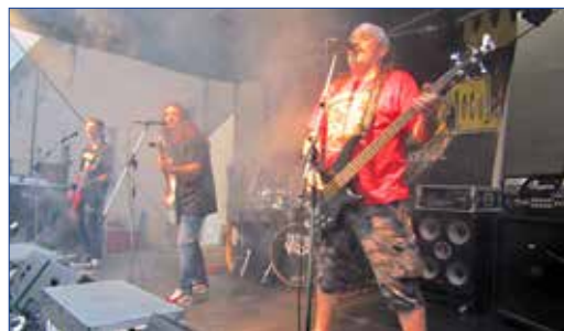
■ Hudební fanoušky rozproudila kromě skupiny Alkohol revival (na snímku) i kapela Akrobat.