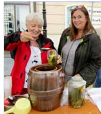
■ Slavnost Porcinkule se v Hořovicích konala v neděli 1. srpna. Kromě bohatého kulturního programu byly pro návštěvníky připraveny i prodejní stánky, velmi žádané byly například rychlokvašky.

spokojených návštěvníků. Akci pořádal spolek Horovize, z. s. ve spolupráci s Římskokatolickou farností Hořovice, Farním sborem ČCE v Dobříši a Hořovicích, MKC Hořovice dalšími spolky, dobrovolníky a sponzory. (var)