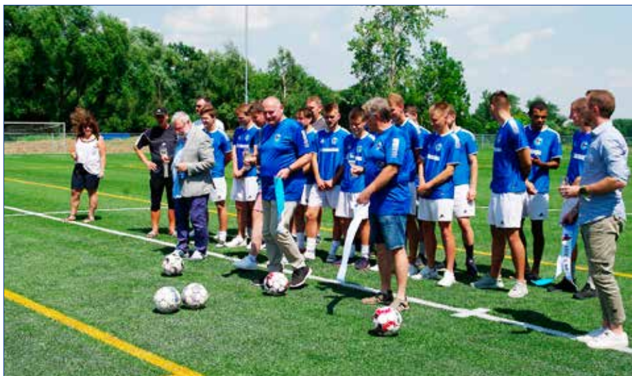
■ Oslava 111. výročí fotbalu v Hořovicích se uskutečnila v sobotu 24. července. Součástí oslav bylo oficiální otevření hořovického hřiště s umělou trávou.