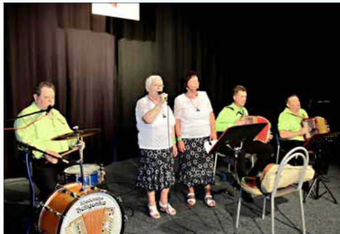
■ Diváci potěšili i Kladenští heligonkáři.