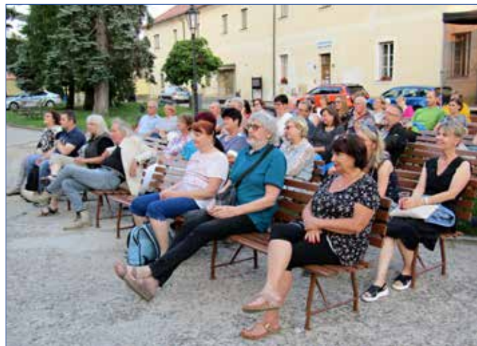
■ Představení diváci zhlédli v pátek 23. července na nádvoří Starého zámku. Další snímky na webu MKC Hořovice v odkazu FOTOGALERIE.