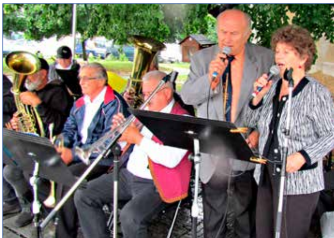
■ Na Palackého náměstí už od ranních hodin vyhrávala dechová hudba.