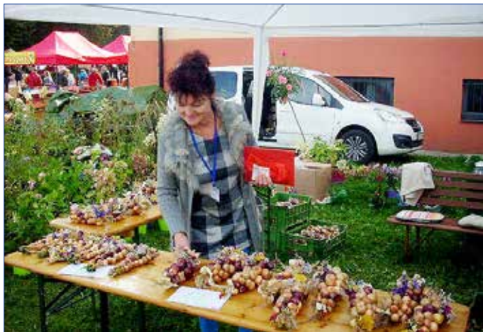
■ Cibulový jarmark se letos konal v komornější verzi.