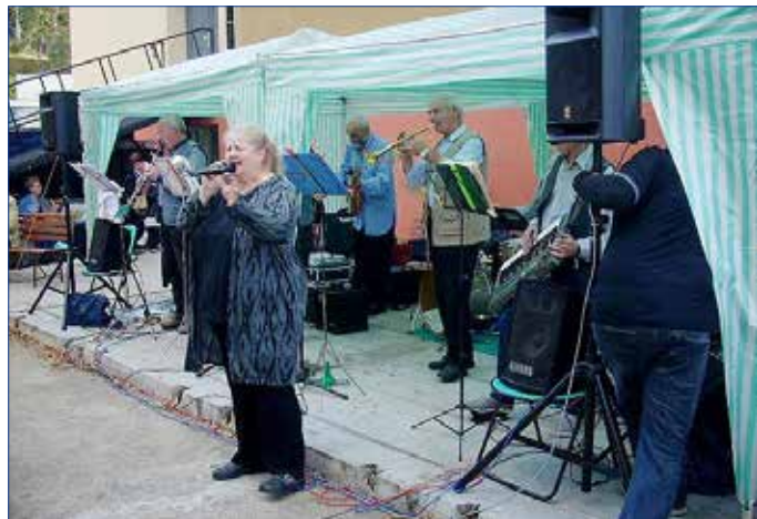
■ Na akci vystoupil Dixieland Band Zdice.