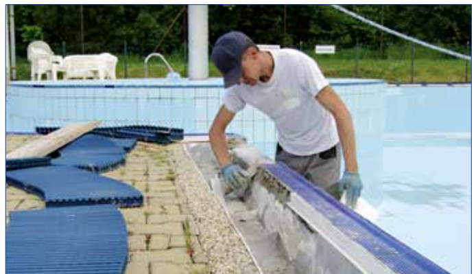
■ V první polovině roku byly opraveny venkovní bazény Aquaparku Hořovice.