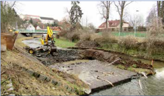
■ Rekonstrukci stanice povrchových vod na Červeném potoce provedl na začátku roku Český hydrometeorologický ústav.