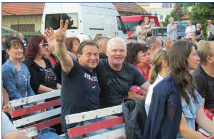
■ Koncert skupin Queen Pilsen Tribute a Bohemian Pink Floyd.