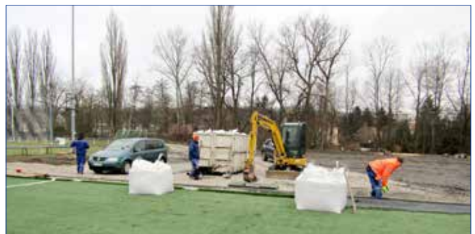
■ Víceúčelové hřiště s umělou trávou.

K dalším stavebním pracím roku 2021 patří například rekonstrukce komunikací v ulicích Nádražní, Na Kopečku a Kamenné nebo adaptace prostor pro Stacionář ve Společenském domě.