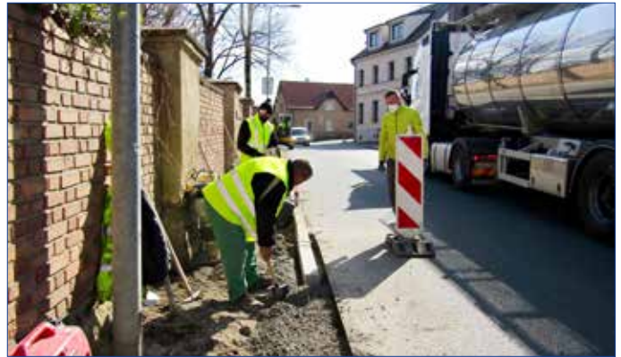
■ Výstavba přechodu pro chodce frekventované křižovatky Pražská x Příbramská ulice, jejíž součástí bylo vybudování nového chodníku podél zámecké zdi.