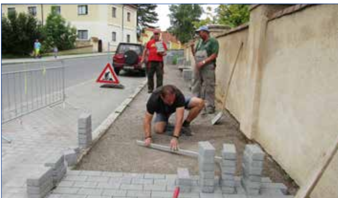
■ Chodník podél zdi státního zámku Hořovice v ulici Vrbovská opravili pracovníci Technických služeb města Hořovice.