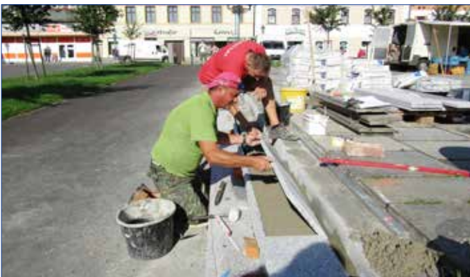
■ V uplynulém roce byly opraveny chodníky a schodiště na Palackého náměstí.