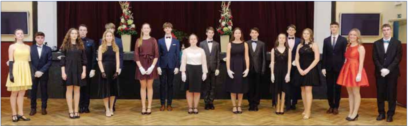
■ Fotografie ze semifinále soutěže v tanečních - předvánoční lekce pro kurz H7 podzim 2020.