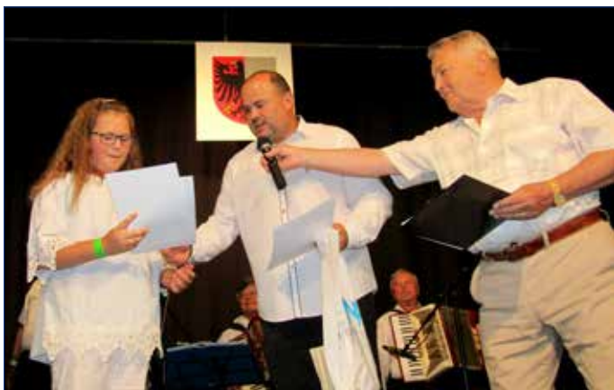
■ Hořovická heligónka.