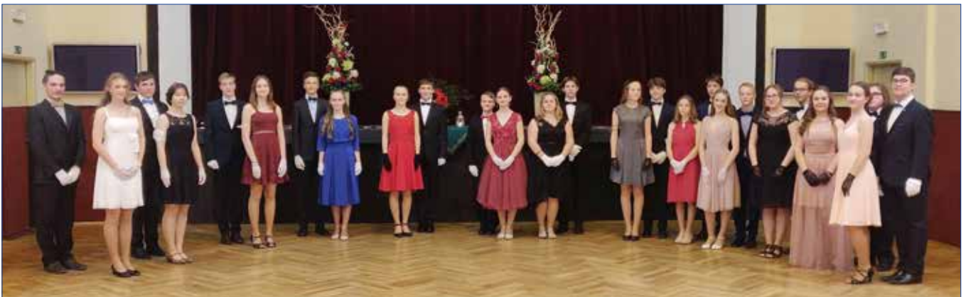
■ Tento snímek je ze semifinále soutěže v tanečních - předvánoční lekce pro kurz H7 podzim 2021.