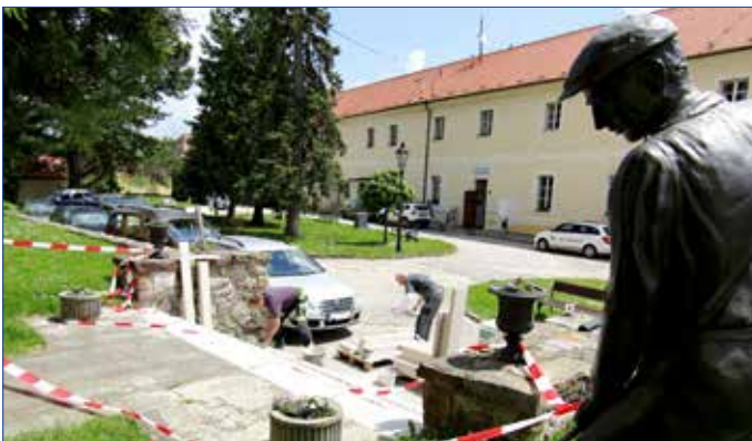
■ Úprava vstupu k původní tvrzi v areálu Starého zámku se uskutečnila díky podpoře Středočeského kraje.