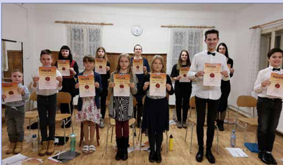
■ Zpívání koled v ZUŠ Josefa Slavíka v Hořovicích. Více na straně 5.

Na našich sídlištích se objevily nové hrací prvky pro naše nejmenší. Původní hrací prvky nejen, že fyzicky zestárly, ale zejména nesplňovaly náročné