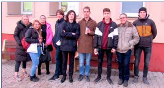
■ Skupina gymnazistů před darováním krve.