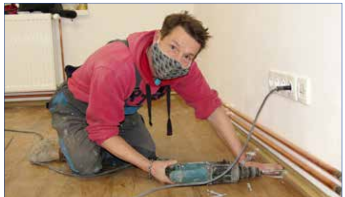
■ Rekonstruované prostory v budově Starého zámku nově využívá Středisko volného času Domeček Hořovice.