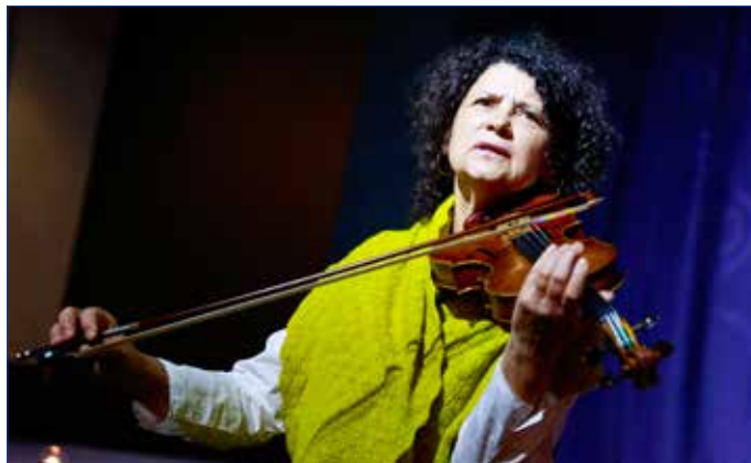
■ Iva Bittová.