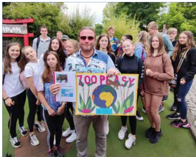
■ 2. ZŠ Hořovice adoptovala v Zoo Plasy levharta. Spolupracuje i se ZOO Praha.

Škola získává peníze z různých zdrojů. Největší částku dostává od MŠMT. Z těchto peněz hradí platy pedagogů a pomůcky. Finanční prostředky získané od zřizovatele –