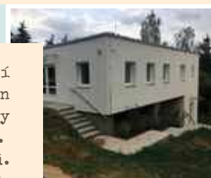
Denní centrum pro osoby bez přístřeší - Charita Beroun Kontaktní místo pro terénní programy - Magdaléna, o.p.s. - Lomikámen z.ú. Plzeňská 1641