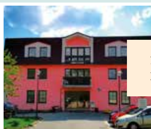
Domov Na výsluní, Hořovice Pražská 932