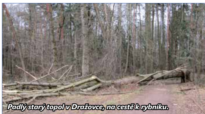
Padlý starý topol v Dražovce, na cestě k rybníku.

Libor Myslivec, LESOSPOL Zbiroh spol. s r. o.