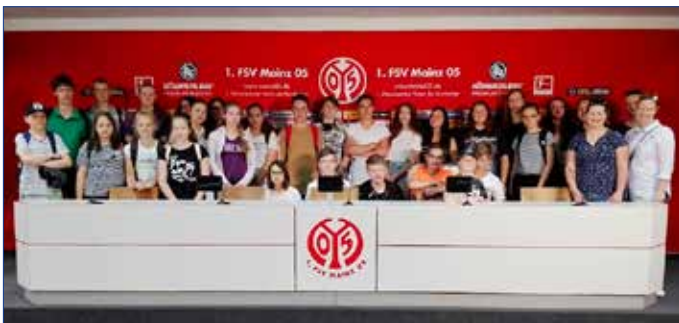
■ Spolupráce 2. ZŠ Hořovice se školou v partnerském městě Gau-Algesheim trvá od roku 2015 a dále se úspěšně rozvíjí.