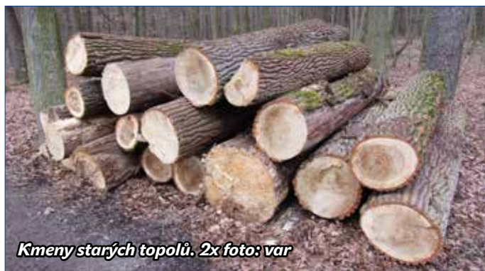
Kmeny starých topolů. 2x foto: var

Autory petice neznám a oni neznají mě. Nechápu, proč o společnosti, kde pracuji a kterou spoluvlastním, takto píší. Nechápu, proč se nás třeba před tím na něco alespoň nezeptají. V petici totiž nezmiňují Městský úřad Hořovice, ale firmu LESOSPOL Zbiroh.