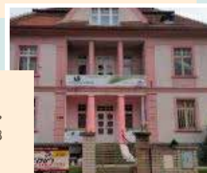
Centrum denních služeb - Digitus Mise, z.ú. Pražská 904/28