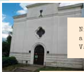
Nízkoprahové zařízení pro děti a mládež - Charita Starý Knín Valdecká 408