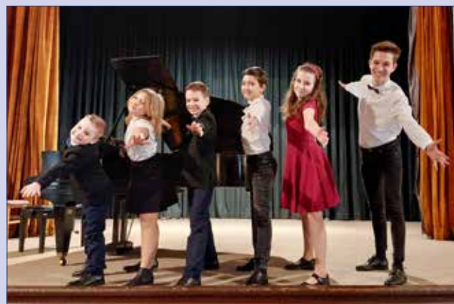
■ Na snímku hořovičtí vítězové okresního kola soutěže základních uměleckých škol v sólovém a komorním zpěvu. Více k akci uvnitř listu.

telstvo obce (města) je nejvyšším orgánem obce. Zastupitelé obvykle na svém ustavujícím zastupitelstvu po volbách volí starostu, radu města a výbory zastupitelstva. Povinností ze zákona je zvolit výbor finanční a kontrolní. Dále pak zastupitelé mohou ustanovit výbory další, třeba výbor pro zahraniční spolupráci. Menší obce nemají povinnost volit radu obce a její funkci plní starosta. Součástí rady jsou také místostarostové, které stejně jako ostatní radní volí zastupitelstvo. Volení zastupitelé mohou být na uvolněných nebo neuvolněných funkcích. Uvolněný bývá obvykle starosta nebo místostarosta a znamená to, že svou funkci vykonávají na plný