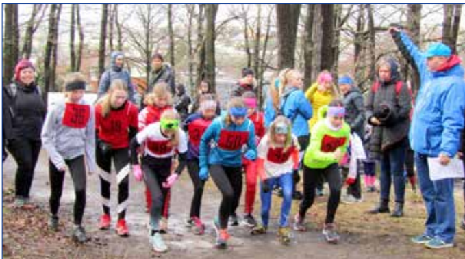
■ Na start 35. ročníku Jarního běhu Dražovkou se postavilo 114 dětí a 250 dospělých.