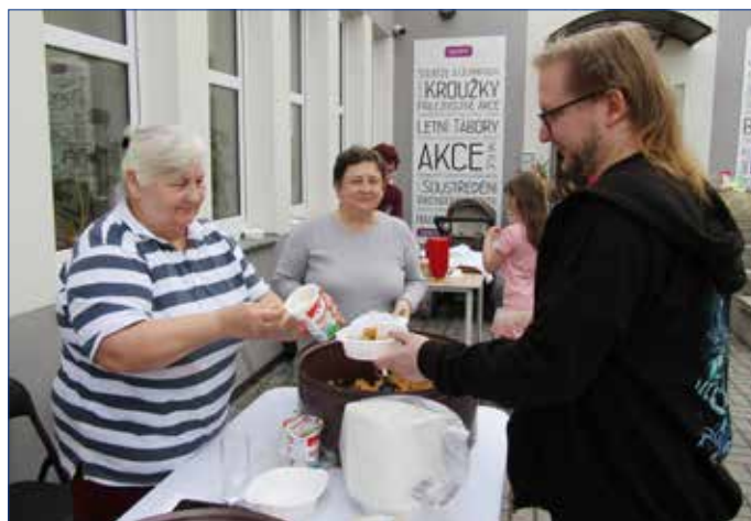
■ Součástí dubnové akce Domečku Hořovice byla i ochutnávka ukrajinského jídla.