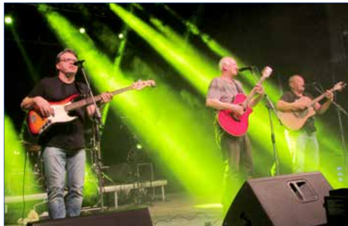
■ Všechny hudební skupiny se vzdaly svého honoráře, a to ve prospěch Ukrajiny. Na snímku kapela EKG-M.