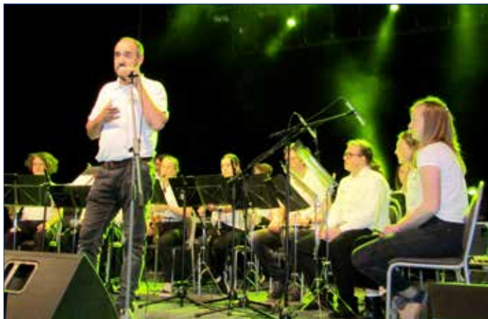
■ Hořovický koncert pro Ukrajinu se uskutečnil 6. dubna ve Společenském domě. Jako první zahrála kapela ZUŠ Josefa Slavíka Hořovice Horband.