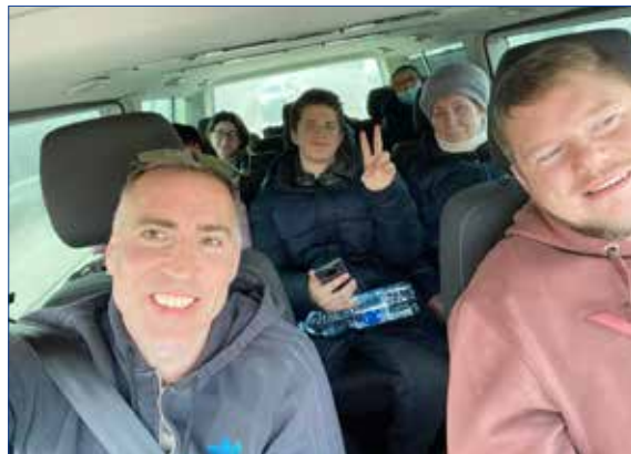
■ První cesta z polského města Przemysl.

Toho si také moc cením. Pomocí lidem, kteří k nám přicházejí, je velmi dobře nastavená. A to v rámci komunikace s městem, se sociál-