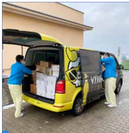
■ Nadace Výjimeční vznikla v roce 2020.

Mým úkolem je z osobních schůzek z celé ČR připravovat nadační projekty, které následně schvaluje nadační rada.