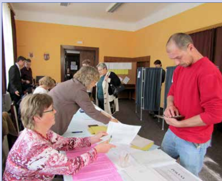
■ K VOLBÁM do zastupitelstev obcí konaných ve dnech 23. a 24. září 2022 přišlo 42,84 % hořovických voličů.