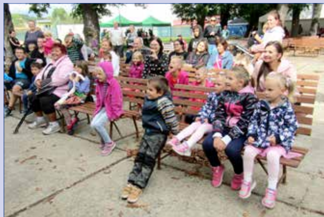
■ Zástupci Mikroregionu Hořovicko připravili pro děti a jejich rodiče v zahradě Společenského domu zábavné odpoledne.

Všechny snímky soutěžní výstavy HOŘOVICE VE FOTOGRAFIÍCH jsou k vidění na webu: https://mkc-horovice.cz/knihovna-5/fotogalerie-knihovna/