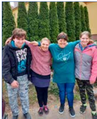
■ Žáci se věnují řadě projektů.