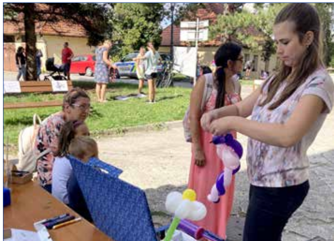
■ S prázdninami se děti rozloučily na nádvoří hořovického Starého zámku.