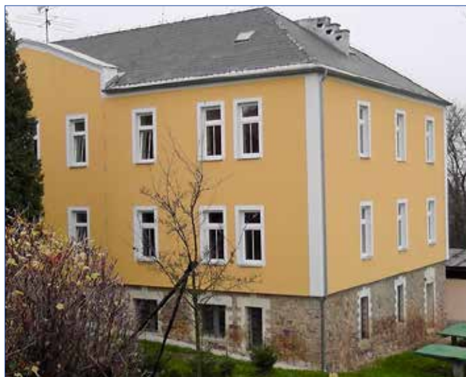
■ Základní škola Hořovice se nachází v blízkosti autobusového nádraží.

V červnu 2021 oslavila naše škola 70 let. V průběhu 70 let se ve zdech školy vystřídal mnoho skvělých pedagogů, kteří se zasloužili o její neustálý rozvoj. A mnohdy to nebyla cesta jednoduchá. Byli to a jsou kantoři, kteří přinášeli denně žákům nejen vědomosti, ale i kus sebe. A tento kousek zůstal jak v hlavách a du-