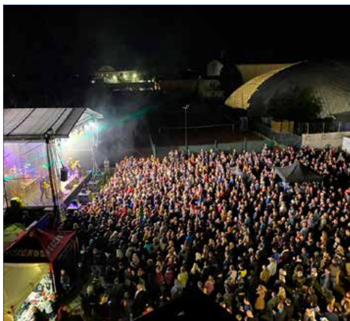
■ Koncert skupiny Harlej si užilo dva tisíce návštěvníků.