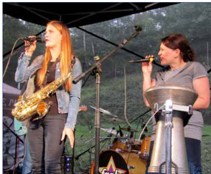
■ Na dvou podíích se vystřídala řada kapel rozličných žánrů. Nechyběl doprovodný program, zpestřením byl krásný ohňostroji.