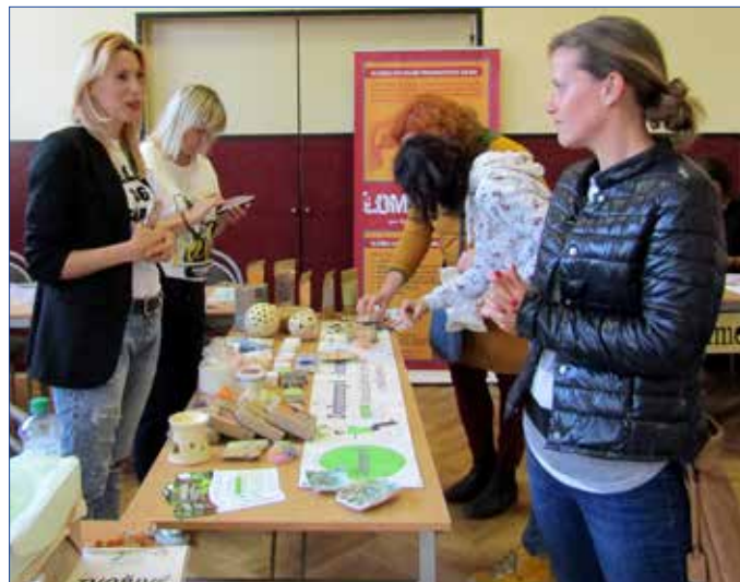
■ Ve Společenském domě se představili poskytovatelé sociálních služeb. Návštěvníci si zde mohli prohlédnout i výstavu historických fotografií.