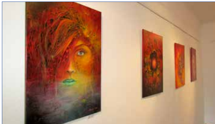
■ Současná výstava nese název Z plenéru i ateliéru.

Hořovická Galerie Starý zámek je otevřena vždy v pátek, sobotu a neděli 10 - 18 hodin. Návštěvu mimo tuto otevírací dobu si můžete zajistit na telefonním čísle IC Hořovice 732 512 821. (var)