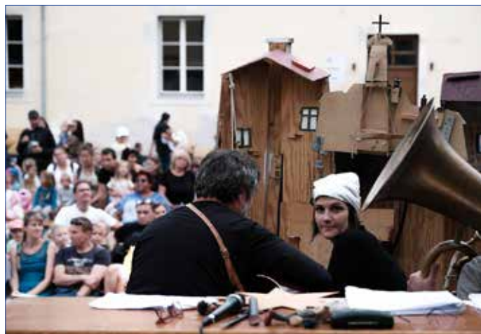
■ Zpestřením akce Loučení s prázdninami byla pohádka Divadla Na Holou O Čertovi.

Akci podpořila Česká průmyslová zdravotní pojišťovna sponzorským darem v podobě pexesa a omalováněk. Členky spolku Sedmíkráska upekly perníčky a společnost Smurfit Kappa Žebrák darovala 120 lepenkových majáků. Potěšily i kartonové dýně a rybičky. Pořadatelé sponzorům děkují za dary a návštěvníkům za účast. (var)