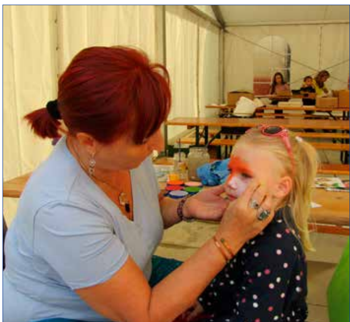
■ Sedmíkráska připravila doprovodný program pro děti. Nechybělo malování na obličej.