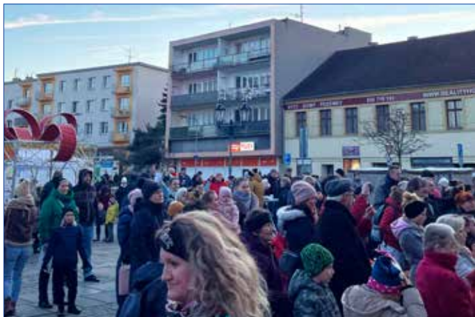
■ Odpolední adventní atmosféra.