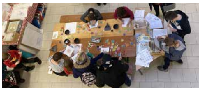
■ Adventní dílničky.