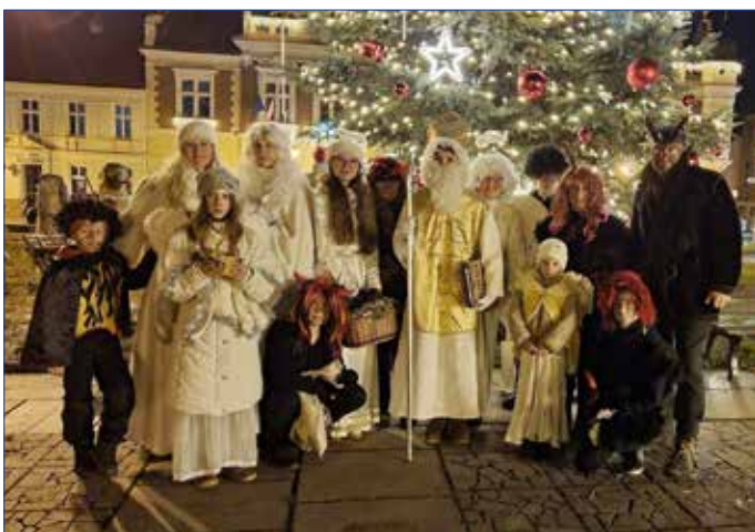
■ Mikuláš v Hořovicích.