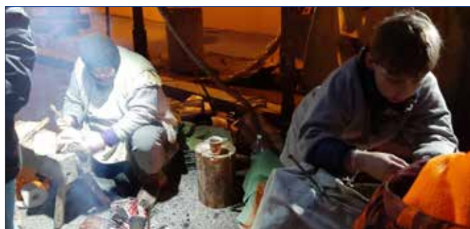
■ Ukázky řemesel na adventním trhu.