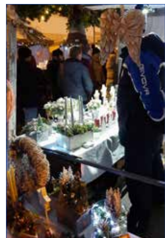
■ Adventní stánkový prodej zajistil Spolek Horovize.

Renata Babelová předsedkyně spolku Sedmikráska