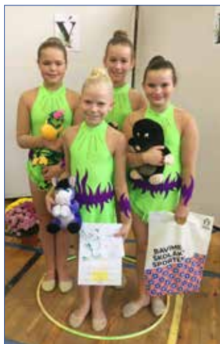
■ Společná skladba I. kategorie s obručemi po závodech v Mariánských Lázních.