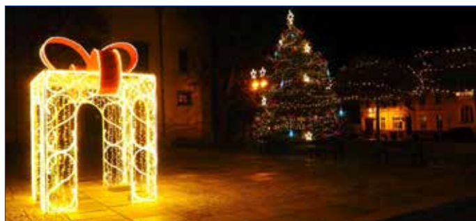
■ Vánoční výzdoba.