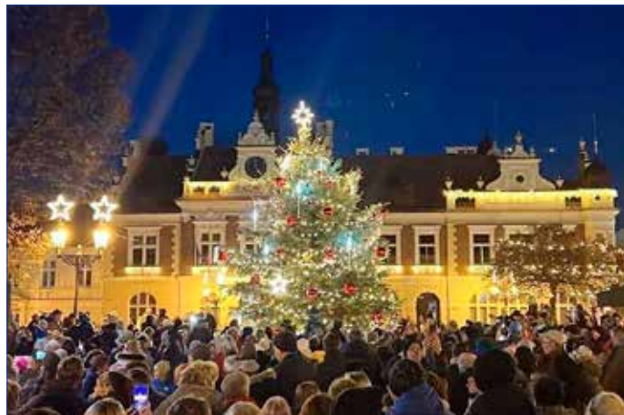
■ Atmosféra 1. adventní neděle na Palackého náměstí.