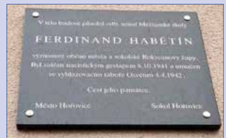
■ Pamětní deska na SOŠ Hořovice.

Pozn. redakce: Vážení občané, máte doma fotografii, která je připomínkou osobnosti, místa či události vztahující se k Hořovicím? Pošlete ji s krátkým příběhem. Rádi Váš příspěvek zveřejníme v této rubrice. Napsat můžete na email: ic@mkc-horovice.cz nebo mestan@mkc-horovice.cz . Těšíme se na vaše příspěvky!