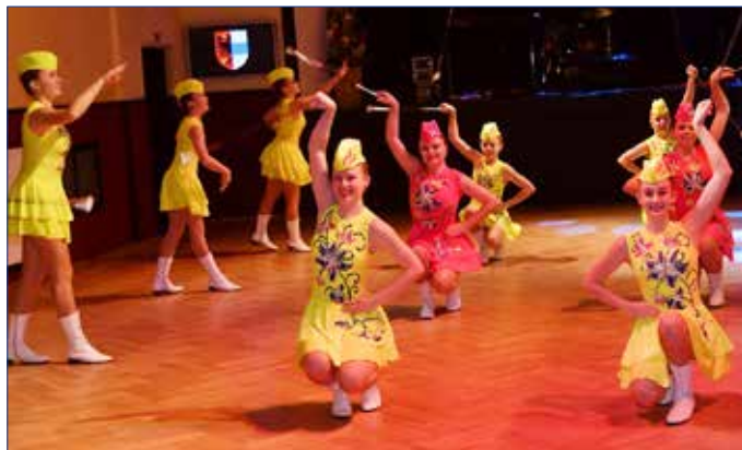
■ Městský ples zpestřily svým vystoupením mažoretky TJ Spartaku Hořovice.