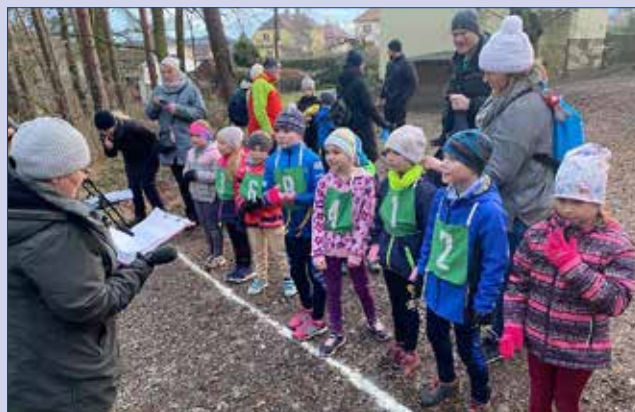
■ Start kategorie holky a kluci 8-9 let.