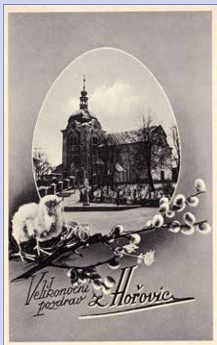
■ Velikonoční pozdrav z Hořovic na pohlednici vydané v r. 1935, Archiv I. Voráčková.