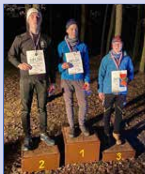
■ Vyhlášení kat. kluci 14-15 let.