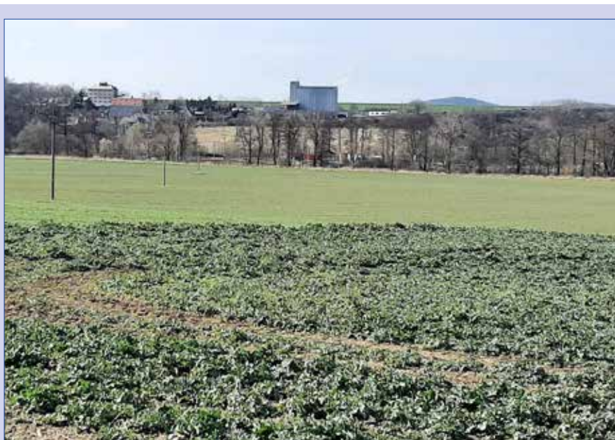
■ Zhruba v těchto místech v budoucnu povede tzv. Východní obchvat.

Pokud vše na zastupitelstvu dopadne dobře,