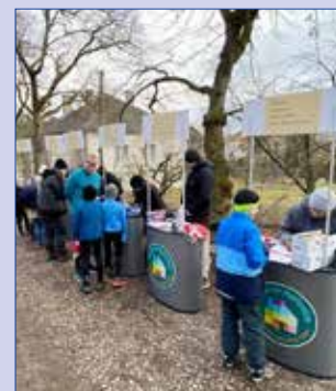
■ Prezentace závodníků.