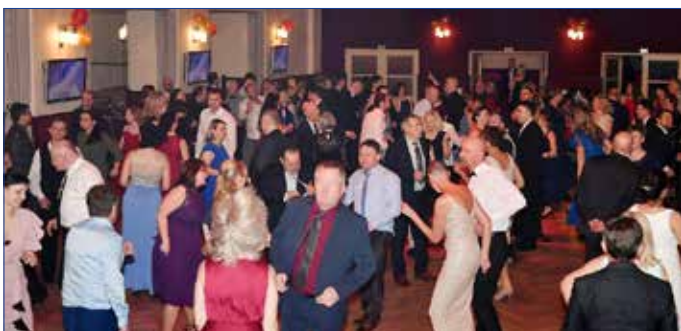
■ Taneční parket byl po většinu večera zcela zaplněn.