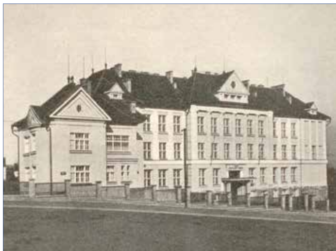
■ Historická fotografie budovy gymnázia.