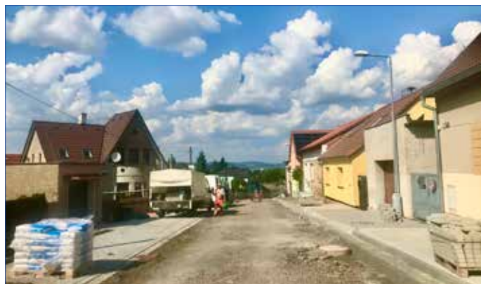
■ Rekonstrukce ulice Dr. Holého finišuje.

fám, že se podobná situace nebude opakovat v ulici Tyršova, která je rovněž krajskou komunikací a také dostane nový povrch od kruhového objezdu až po výjezd z Hořovic směrem na Žebrák. Vážme si toho, že Středočeský kraj investuje do svého majetku v intravilánu našeho města, a respektujme dopravní značení, ať nám nové silnice vydrží co nejdéle. V letošním roce bychom ještě rádi stihli kompletní opravu povrchu ulic 1. Máje, Sklenářka, Kpt. Matouška a Lesní metodou flexibilního zemního betonu. Z menších oprav a úprav bych ráda zmínila nové obrubníky pod parkovištěm u nemocnice, kde opakovaně docházelo k parkování nákladních vozidel a autobusů a poškozovala se tak nejen krajnice vozovky, ale i přilehlý svah. Opraven byl povrch chodníku kolem 2. ZŠ na Víscce, který byl ve velmi špatném stavu. S komunikacemi úzce souvisí i blokové čištění sídliště Višňovka, které proběhlo na konci druhého srpnového týdne. Děkuji tímto všem obyvatelům a řidičům, kteří přesunuli svá vozidla tak, abychom mohli čištění řádně provést. Odměnou nám jsou perfektně čistá parkoviště, silnice i chodníky. Nyní proběhne projektování modrých parkovacích zón