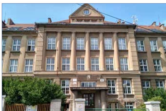
■ Současný pohled na vstup do Gymnázia Václava Hraběte.

Výrazným znakem je vytvoření široké škály volnočasových aktivit pro studenty a jejich aktivní zapojení do nich. Škola se orientuje především na kulturní a sportovní oblast. Středoškolský sportovní klub nabízí bohaté sportovní vyžití. Vybraní studenti se zúčastňují v zimě běžkařského kursu a v květnu cykloturistického kursu. Atraktivní jsou outdoorové