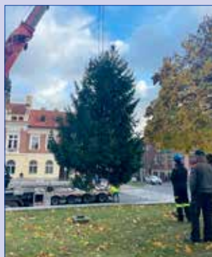
Osazování vánočního stromu na Palackého náměstí.