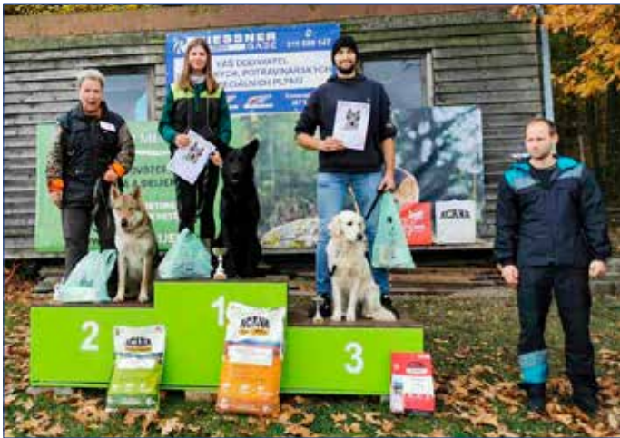
■ Stupně vítězů v kategorii ZZO1