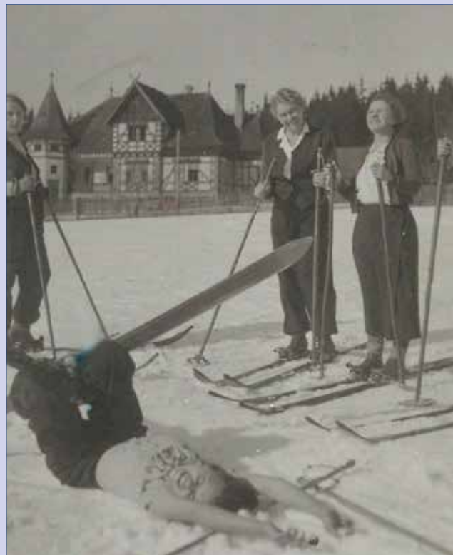
■ Lyžařky 27. února 1938 na louce před myslivnou na Borské v Brdech.