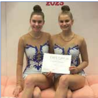
■ Seniorská dvojice na MČR dvojic a trojic v Havířově.