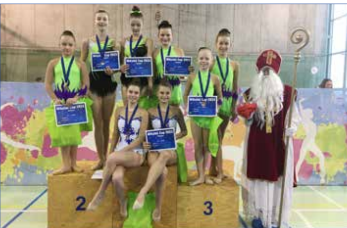
■ Mikuláš Cup 2023. Dívky po úspěšném závodě v Klánovicích, odkud si všechny společné skladby odvezly medaile.