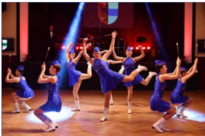
■ Nechyběly ani Hořovické mažoretky.