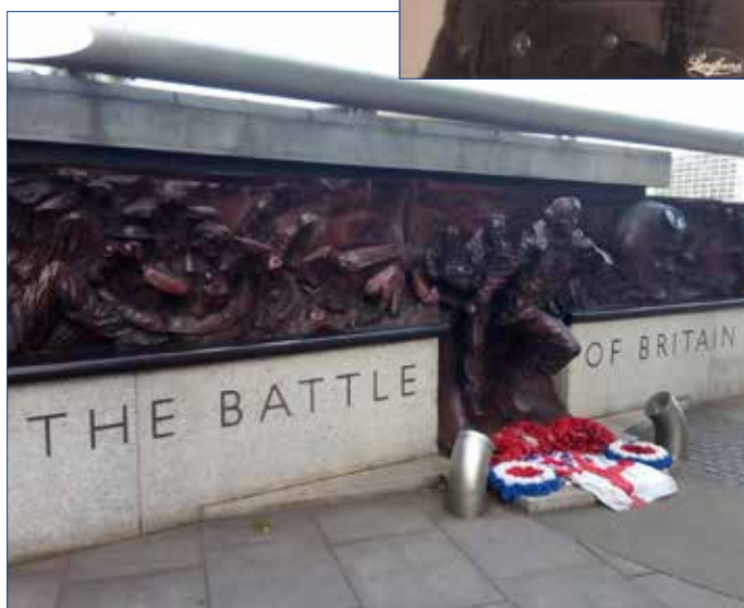
■ Památník Bitvy o Británii.