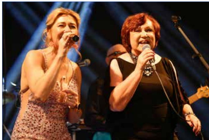
■ Hlavním hostem večera byla zpěvačka Petra Janů.