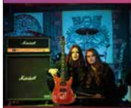
kapela Beat Sisters

19. 5. 2024 | 10:00-18:30 h. Zahrada Společenského domu Hořovice