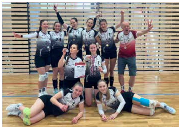
■ Hořovické kadetky s krajským stříbrem na krku.

čeká 27. a 28. dubna v Teplicích. V době vydání Měštana už budou výsledky známé a najdete je na FB Volejbal Hořovice. V kategorii U20 se nakonec obě naše družstva kadetek dostala do krajského finále. Tady už bylo o celkovém pořadí víceméně jasno už před turnajem, takže do medailové sbírky přibyla stříbrná a bramborová. V kategorii U16 máme trochu věkovou mezeru, takže družstvo bylo doplňováno mladšími závkyněmi. I přesto holky obsadily v krajském přeboru skvěle 5. místo z 38 týmů a jen těsně jim unikl postup do FinalFour. Nejvíce hraní ještě čeká mladší závkyně U14. V krajském přeboru mají za sebou první finálový turnaj, který