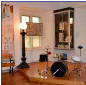
■ Bubny v Muzeu Hořovicka.

V sobotu 18. 5. slavíme mezinárodní den připomínající tyto kulturní instituce, svátek byl vyhlášen asociací ICOM a poprvé byl zmiňován v roce 1977. V sou-