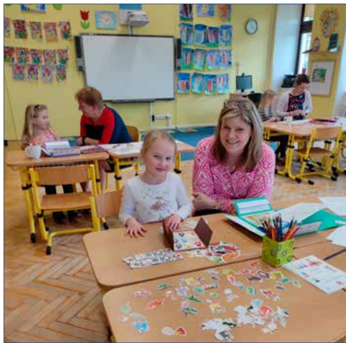
■ Fotografie ze zápisu 2. ZŠ Hořovice od Aničky Matátkové.

Z hlediska uchazečů na střední školy měli před sebou v půlce