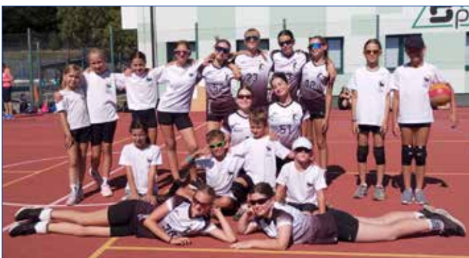
■ Hořovítky účastníci minivolejbalového přeborníka okresu v Berouně (7. 9. 2024).

■ HOŘOVICKÝ MĚŠŤAN, informační měsíčník města Hořovice, č. 10/2024, ročník XVII., vychází 1. 10. 2024.