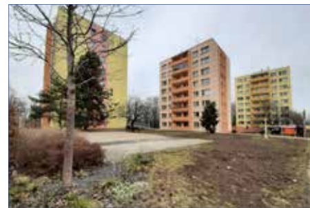
■ Sídliště Višňovka