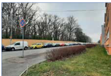
■ Vrbovská ulice

K této investiční akci nyní budeme soutěžit zhotovitele a s její realizací počítáme na podzim letošního roku. Předpokládaná cena rekonstrukce je 5,5 mil. Kč. Vzhledem k dlouhodobým problémům s parkováním ve Višňovce rovněž zadáváme studii, jejímž cílem bude najít takové stavební řešení, které citlivým zásahem do stávající zeleně a úpravami chodníků i komunikací umožní zvýšit počet parkovacích stání pro obyvatele sídliště.