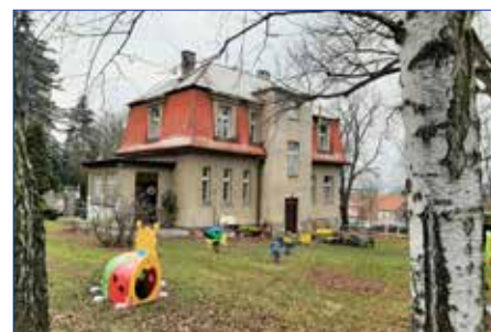
■ Mateřská škola Jiráskova

Projekt je připraven i na kompletní rekonstrukci budovy mateřské školky v ulici Jiráskova. Žádost o dotaci určenou na zřízení dětských skupin jsme podali již v červnu 2024, stále však čekáme na rozhodnutí o poskytnutí této dotace, která by měla pokrýt 100 % uznatelných nákladů. Odhadované náklady projektu činí 27 milionů Kč, spoluúčast města je plánována ve výši 6 milionů Kč. Za tyto prostředky vytvoříme nejen nové moderní prostory pro pobyt dětí, ale obnovíme i zahradu a herní prvky.