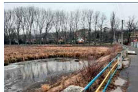
■ Lázeňský rybník