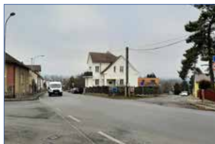
■ Křižovatka ulic Příbramská a Šeříková

Další změny v ulicích pocítí obyvatelé ulice Příbramská, kde by měl vzniknout chodník včetně přechodu pro chodce v části ulice, kde dosud chybí – od křižovatky s ulicí Šeříková po vyústění uličky pro pěší. Umožní tak bezpečný přesun dětí do školy z lokality V Zahradách. Tato akce je spojena rovněž s vybudováním přechodu pro chodce na křižovatce ulice Pražská a Příbramská. Přechod se bude nacházet zhruba v místech dnešního ohybu zámecké zdi. Přechod u prodejny Domáci potřeby bude nově vyznačen blíže ke křižovatce s ulicí Příbramská. Jak vybudování nových přechodů, tak přesun stávajícího zvýší bezpečnost a zlepší rozhledové poměry v oblasti, kde denně chodí desítky dětí do školy. Tato akce je ve fázi vydání povolení záměru. S realizací se počítá na podzim tohoto roku.