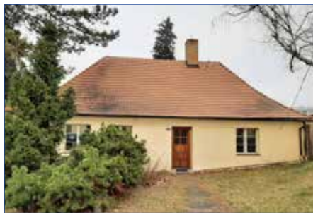
■ Areál Starého zámku - domeček

V areálu Starého zámku proběhne oprava stodoly a domku u vstupní brány pro účelnější využití.