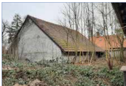
■ Areál Starého zámku - stodola

Věříme, že veškeré stavební akce, které nás v letošním roce v Hořovicích čekají, sice budou znamenat dočasné snížení komfortu, ale do budoucna přinesou nejen větší bezpečnost v konkrétních lokalitách, ale také celkové zlepšení veřejného prostoru ve městě.