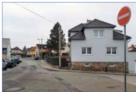
■ Komenského směrem k Husovu náměstí

Asi největší a nejnákladnější investiční akcí letošního roku bude kompletní rekonstrukce ulice Komenského včetně Husova náměstí a přilehlého parku. Stavba by dle plánu měla začít v březnu 2025 a dle nároků bude rozdělena na dvě či více etap tak, aby byl zachován přístup ke škole. Celá ulice projde výraznou proměnou, která usnadní pohyb dětí i rodičů v okolí školy. Rekonstrukce zahrnuje nespočet bezpečnostních úprav komunikace včetně zvýšených křižovatek, přechodů pro chodce, krátkodobých stání i stání pro rezidenty. Místo zde nalezneme i novou zeleň včetně stromů, které v ulici dosud chyběly. Ve spolupráci se společností VAK proběhne kontrola rozvodů vody a kanalizace, abychom předešli pozdějším zásahům do nového povrchu při haváriích. Do země budou přeloženy telekomunikačních sítí společností CETIN. Celková rekonstrukce ulice Komenského a Husova náměstí byla vysoutěžena za 17,4 mil. Kč.