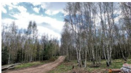
Březové porosty pod Špičákem

(Ze samotného vrcholu není žádný výhled, ale ze severní paseky pod ním 49.7948144N, 13.9165589E se otvírá krásný rozhled k hradu Točník viz níže).